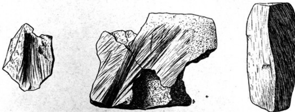
FIG. 25. — Morceau d'ocre de manganèse et de fer, présentant des surfaces et des rainures de raclage ; 3 a la forme d'un trièdre. Grotte des Eyzies. Grandeur vraie.

Mais la forme qui prédomine aux Eyzies, et qui se trouve le plus fréquemment dans les gisements magdaléniens, par exemple à Arudy (Basses-Pyrénées), au Placard (Charente), etc., est une forme légèrement allongée et se terminant à chaque