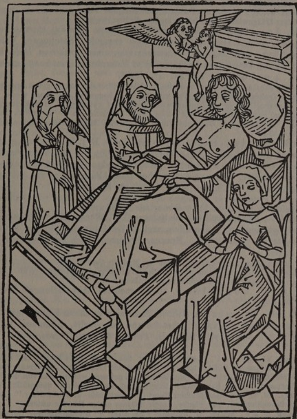
Nr. 455. Versehung von Leib, Seele, Ehre und Gut. Augsb., Joh. Schönsperger, 1493.

Victorius, Ben. Exhortatio ad medicum rectè, sancteque; medicari 458 carpiemem. Medicatio empirica singulorum morborum. Doctrinalis em-