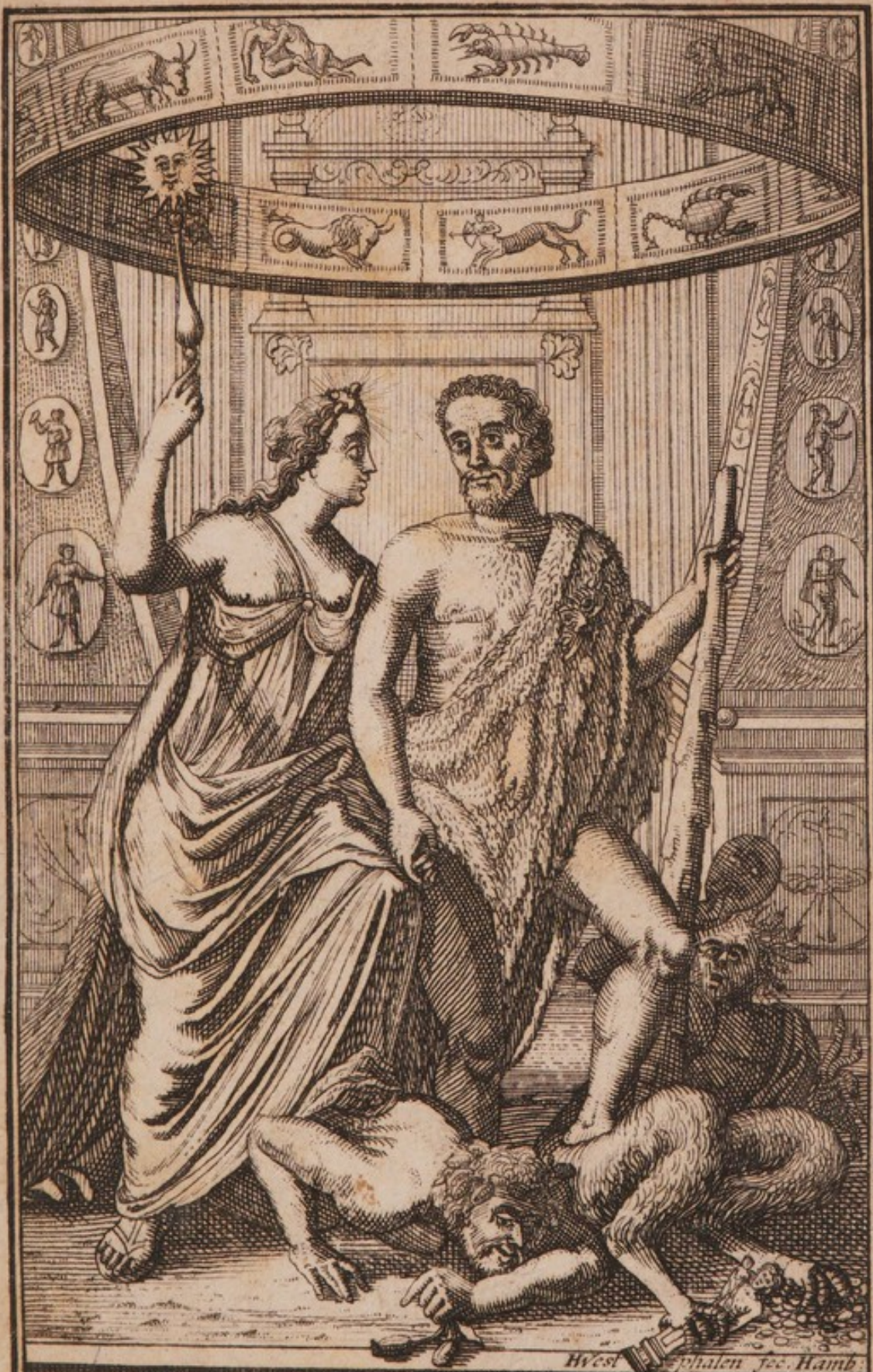
MARCELLI PALINGENII STELLATI POETÆ ZODIACVS VITÆ .