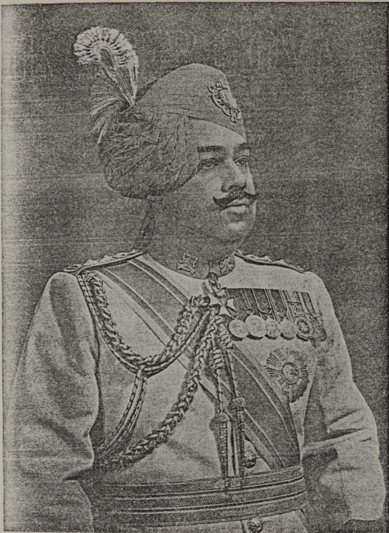
His Highness Maharaja Sri Sadul Singhji Bahadur, Maharaja of Bikaner.