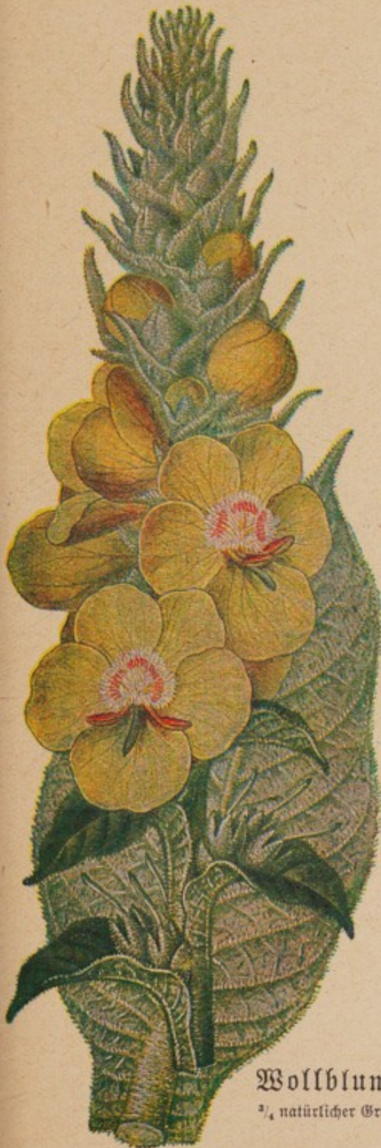
Wollblume. 2 / 3 natürlicher Größe.