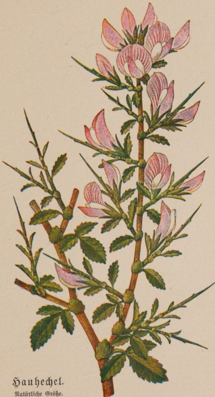
Sauhechel. Natürliche Größe.