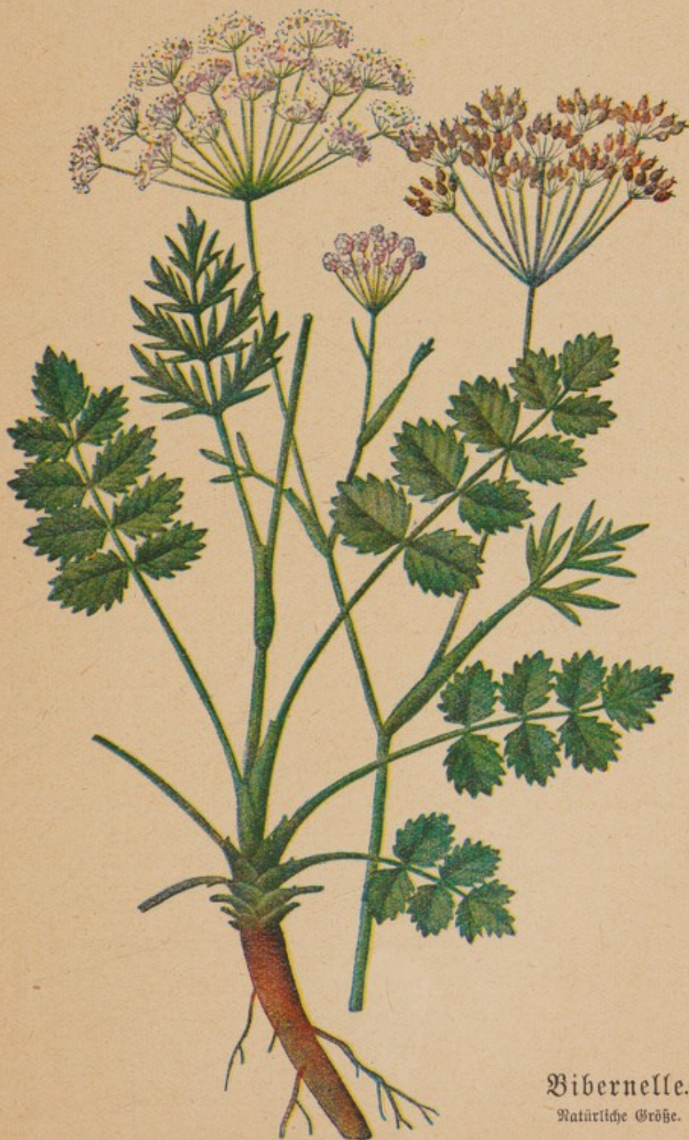
Bibernelle. Natürliche Größe.