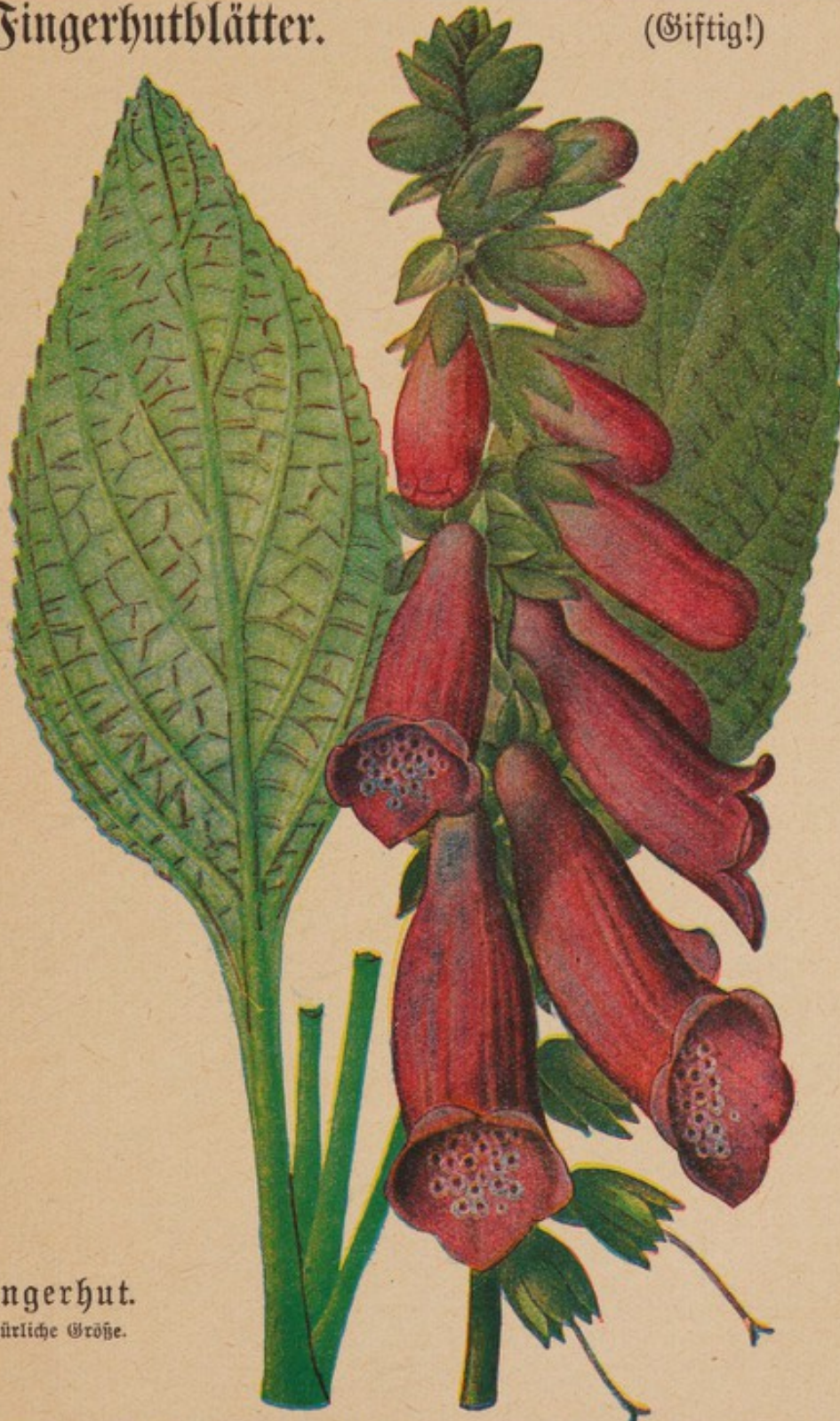
Fingerhut. Natürliche Größe.

Der rote Fingerhut, Digitalis purpurea L., ist eine zweijährige Pflanze, die im ersten Jahr eine ansehnliche Blattrosette hervorbringt. Aus dieser Rosette entspringt dann im zweiten Jahr der bis über 2 m hohe und am Grunde