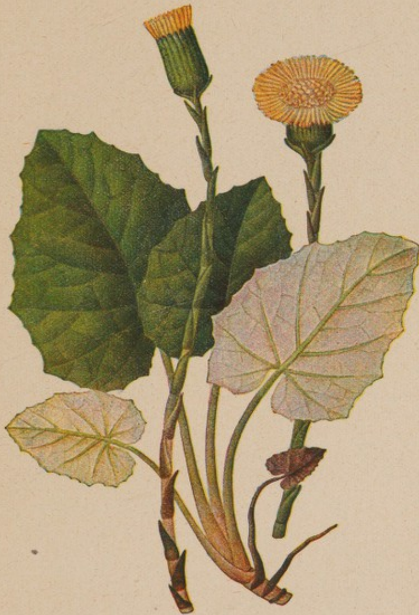
Huflattich. \frac{3}{4} natürlicher Größe.

Der Huflattich, Ackerlattich, Brustlattich, Tussilago farfara L., hat einen ausdauernden, unterirdisch kriechenden Wurzelstock, aus dem gleich zu Beginn des Frühjahrs, noch bevor die Blätter erscheinen, vier bis zwanzig Blütentriebe auslaufen. Diese Triebe sind aufrecht, nicht verzweigt, von