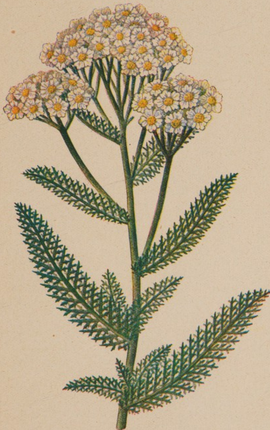
Schafgarbe. Natürliche Größe.