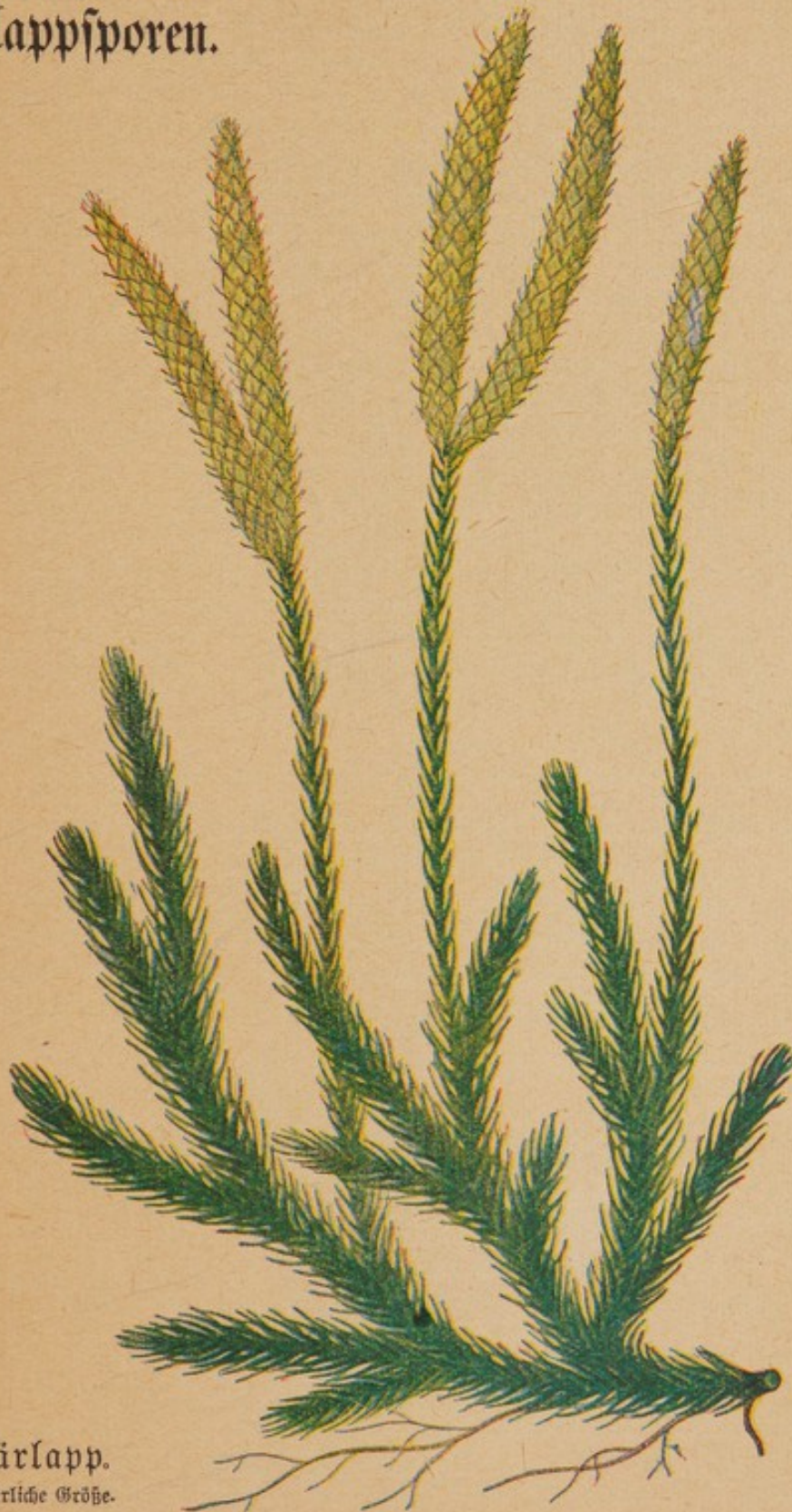
Bärlapp. Natürliche Größe.