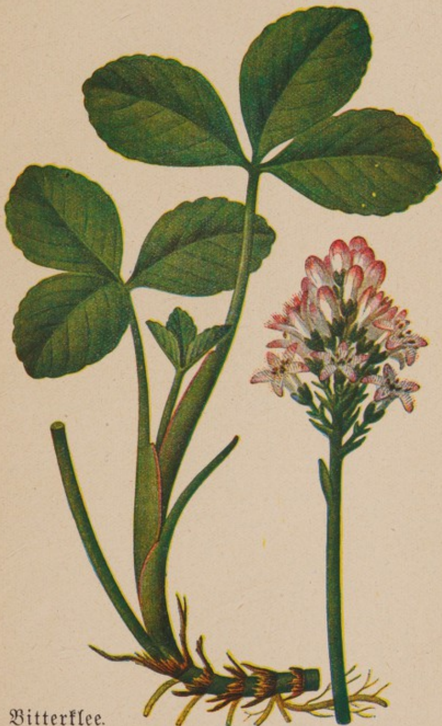
Bitterklee. Natürliche Größe.