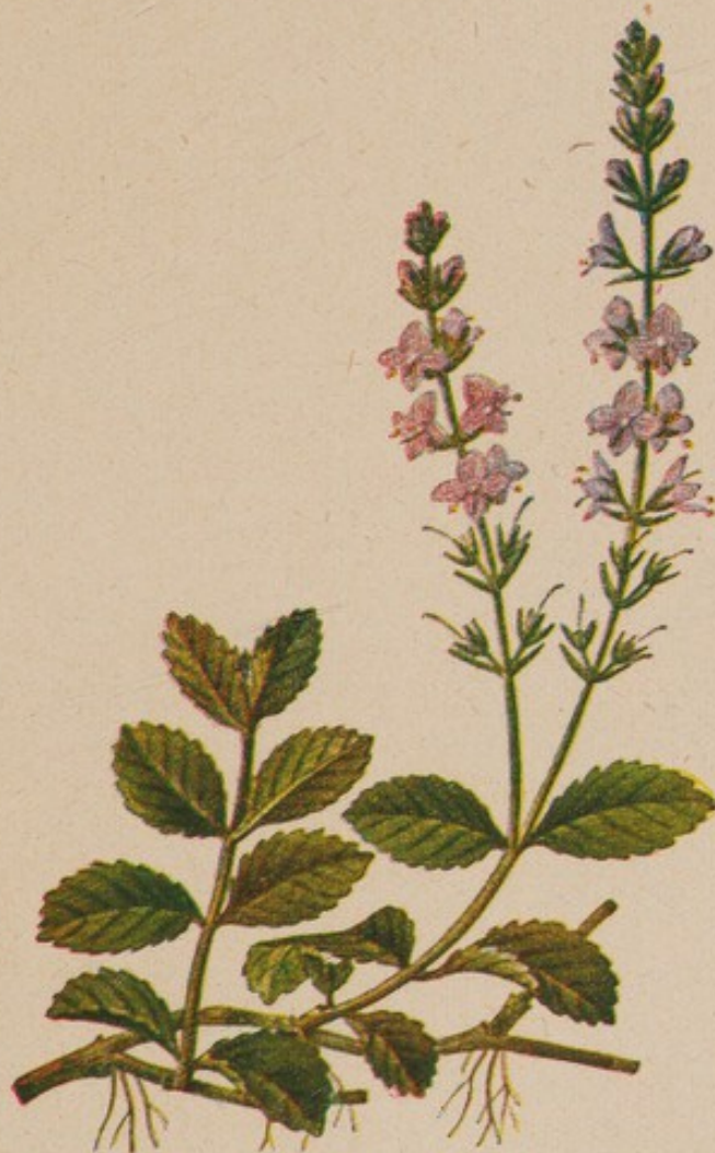
Chrenpreis. Natürliche Größe.

Der Chrenpreis, Veronica officinalis L., ist eine mehrjährige Pflanze mit einem 15—30 cm langen, runden und rauh behaarten Stengel, der auf der Erde kriecht. Am Grunde verästelt er sich vielfach und richtet sich nur mit seiner Spitze und dem Blütenstand auf. Die Blätter stehen stets zu zweien am Stengel einander gegenüber und sind kurz gestielt; sie sind