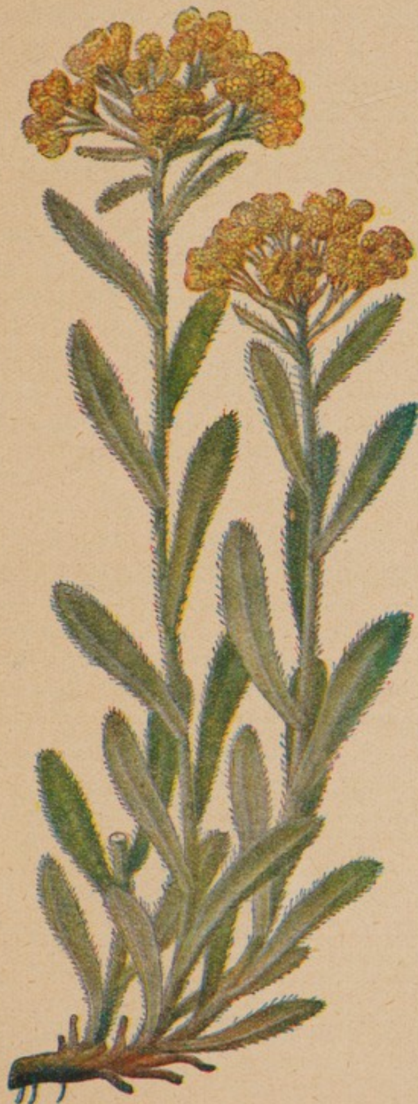
Kahenpfötchen. \frac{9}{10} natürlicher Größe.