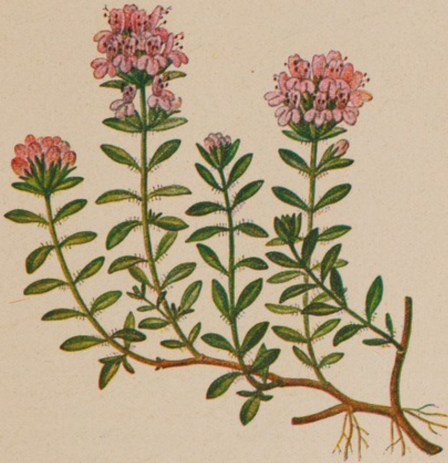
Quendel. Natürliche Größe.

Quendel, Feldthymian, Feldkümmel, Thymus serpyllum L., ist ein Halbstrauch, von dessen Pfahlwurzel zahlreiche holzige, niederliegende, stark verzweigte Stengel auslaufen. Die von diesen Stengeln ausgehenden Zweige sind nicht verholzt, mehr oder weniger aufgerichtet und mit einer rötlichen Rinde bedeckt. Die Blätter stehen stets zu zweien einander an den Zweigen gegenüber; sie sind länglich, am oberen Ende meist abgerundet, nach dem Grunde zu in den bis 3 mm langen Blattstiel verschmälert; sie sind 1—1,5 cm lang, 5—7 mm breit, am Rande glatt und