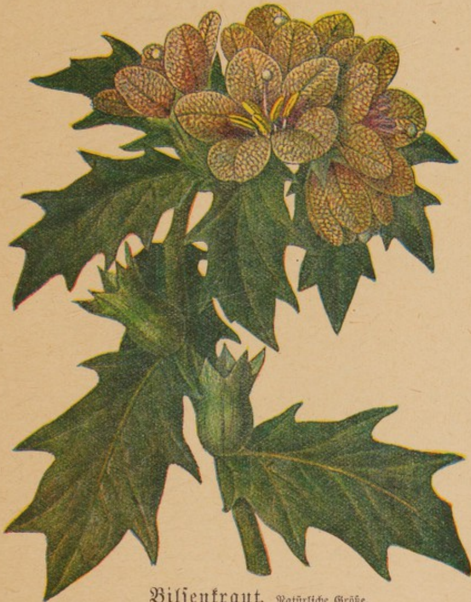
Bilsenkraut. Natürliche Größe.

Das Bilsenkraut, Hyoscyamus niger L., ist entweder einjährig oder zweijährig; die zweijährige Art bildet im ersten Jahr nur eine große Rosette von dicht gedrängten Blättern, aus deren Mitte dann im zweiten Jahre der Stengel hervorbricht. Der aus einer dicken Pfahlwurzel entspringende Stengel ist aufrecht, weich und grün, \frac{1}{2} —1 m hoch; er ist mit Drüsenhaaren besetzt und fühlt sich schmierig an; er ist unverzweigt oder oben in 2—3 Äste geteilt. Die Blätter