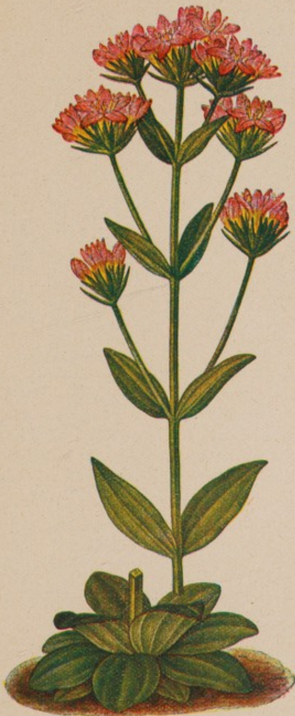
Tausendgüldenkraut. \frac{1}{2} natürlicher Größe.