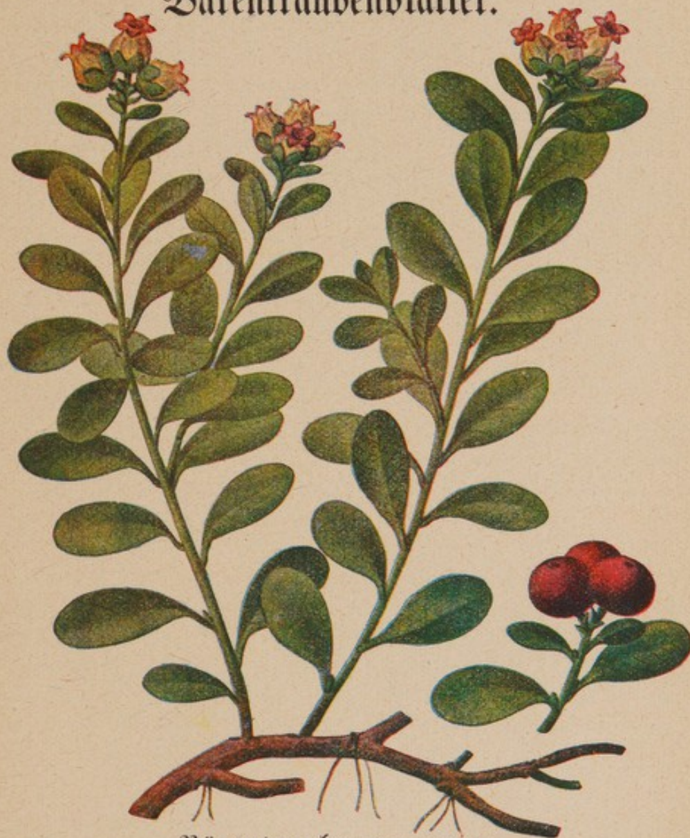
Bärentraube. Natürliche Größe.

Die Bärentraube, Arctostaphylos uva ursi Sprengel, auch gelegentlich Mehlbeere oder Moosbeere genannt, ist ein niedriger, viel verzweigter Strauch. Von seiner kräftigen Pfahlwurzel laufen strahlenförmig Zweige aus, die am Boden aufliegen und nur an den Enden aufstehen; sie sind 40—50 cm lang, holzig und an den Enden krautig, d. h. weich und grün. Die Blätter stehen an den niederliegenden Zweigen ungefähr in einer Ebene; ihr Stiel ist 3—5 mm lang und so wie die jungen Schosse schwach