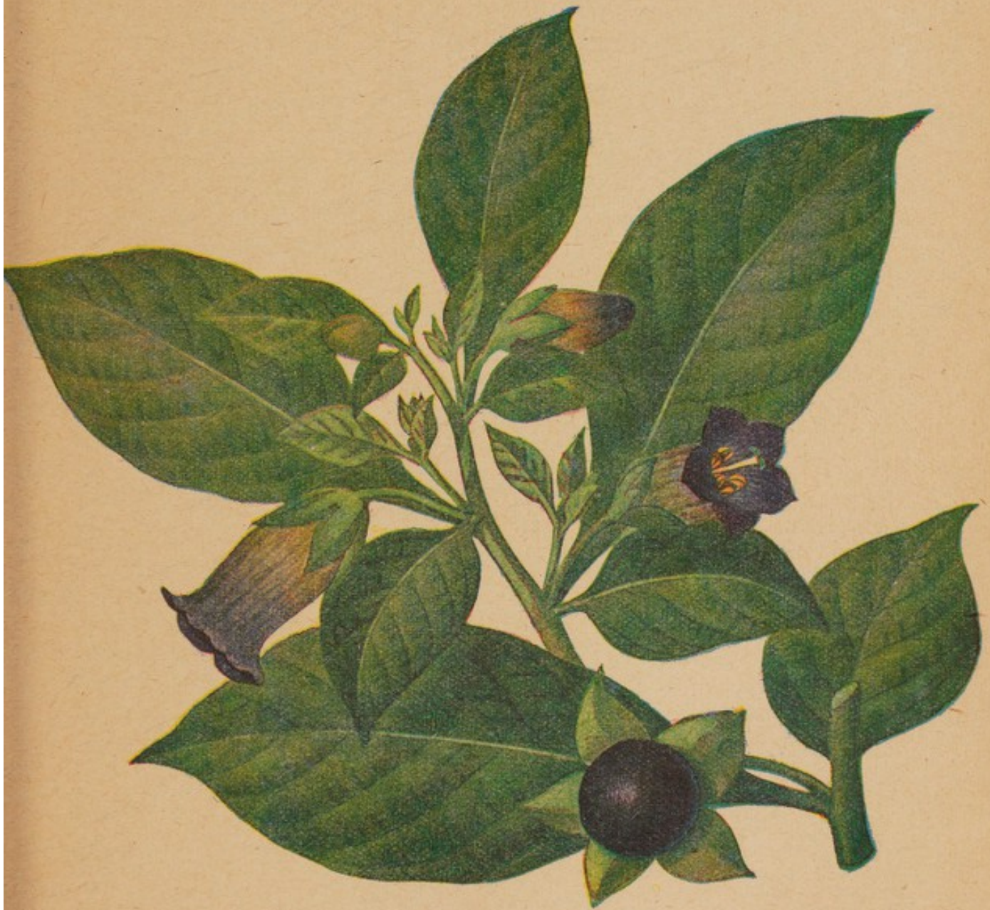
Tollkirsche. Natürliche Größe.

Die Tollkirsche, Atropa belladonna L., ist eine ausdauernde Staude mit kräftiger Pfahlwurzel, die eine Länge bis über 40 cm erreicht und senkrecht den Boden durchzieht. Von der Wurzel laufen ein bis mehrere Stengel aus;