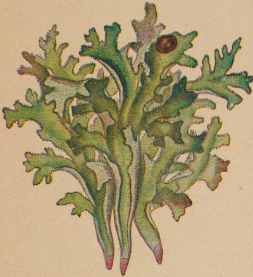
Isländisches Moos. Natürliche Größe.

Isländisches Moos, Cetraria islandica (L.) Ach., ist nicht, wie der deutsche Name sagt, ein Moos, sondern eine Flechte, die in trockenem Zustand knorpelig und brüchig ist und aus einem auf beiden Seiten glatten Körper besteht, der die Größe einer Hand erreichen kann und sich wiederholt in gabelförmig verzweigte und rinnenförmig gebogene Lappen teilt. Diese sind kraus, am Rande mit kurzen, steifen, schwarzen Fransen besetzt. Die obere Seite dieses Körpers ist grünlich-braun, zuweilen mit rötlichen Punkten besetzt, die untere weißlich-hellbräunlich oder graugrün und mit