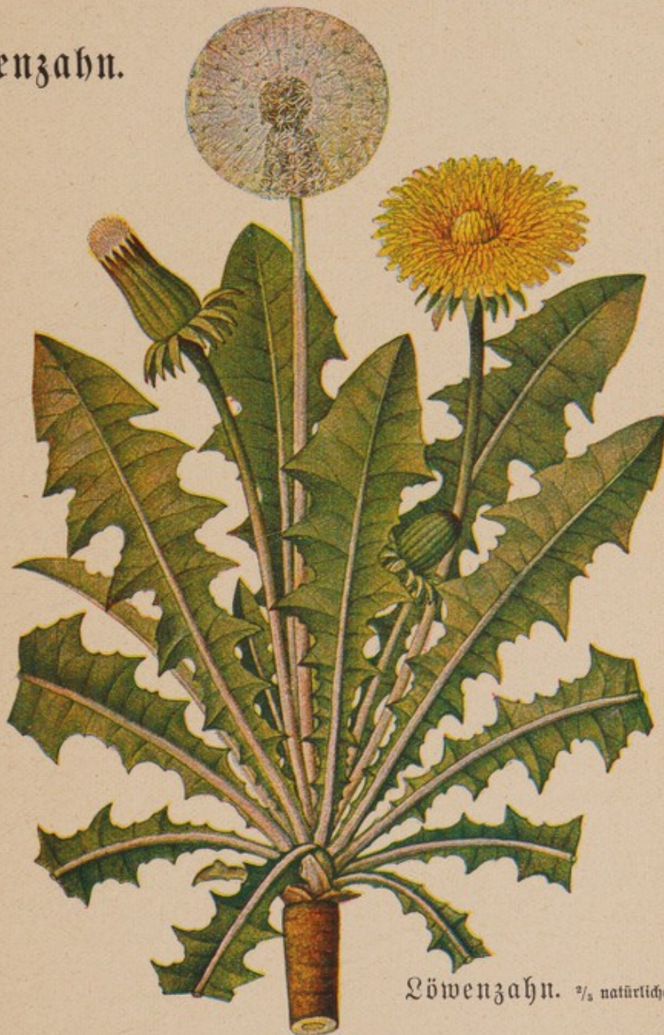
Löwenzahn. \frac{2}{3} natürlicher Größe.

Der gemeine Löwenzahn führt noch viele andere Namen wie Pfaffenröhrchen, Maiblume, Dotterblume, Butterblume, Kettenblume, Wege-lattich, Taraxacum officinale L. Er ist ein Kraut mit ausdauernder dicker Wurzel, die senkrecht tief in den Boden dringt; sie ist einfach oder verzweigt