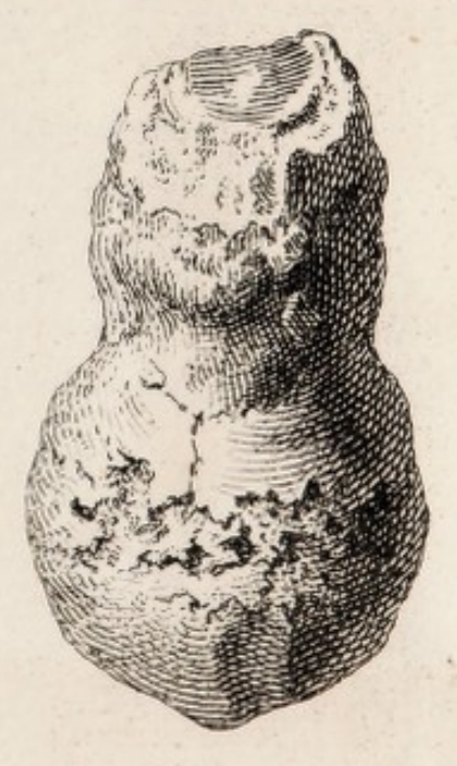
Ger. Vander Gucht Sculp.