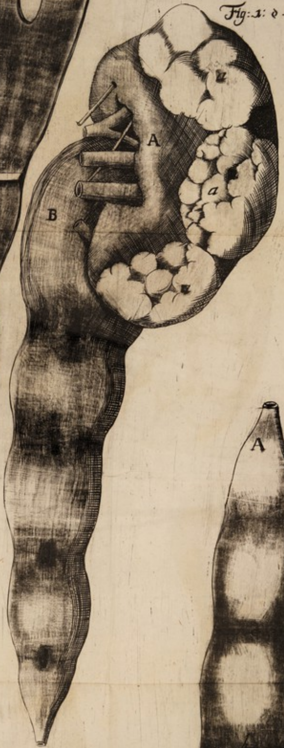
Fig: 1. d. 5.