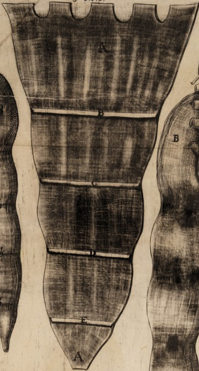
Fig: 3. d. 5.