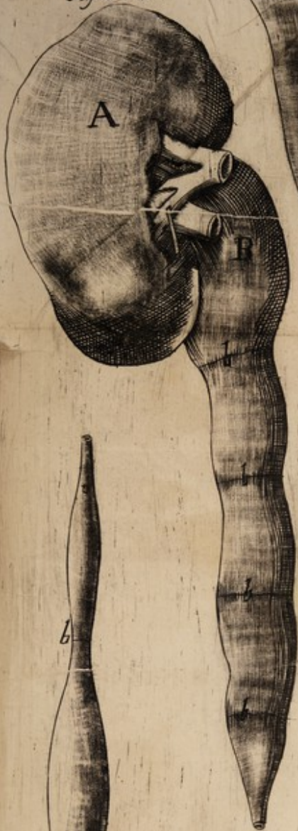
Fig: 2. d. 5.