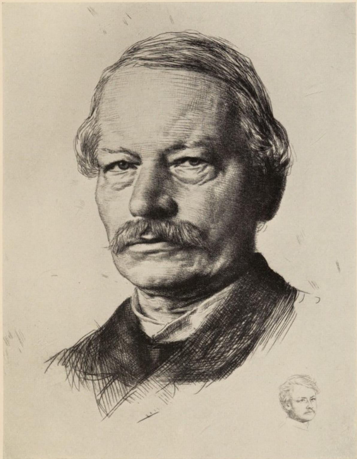
Gustav Freytag Radierung von Karl Stauffer-Bern, 1887