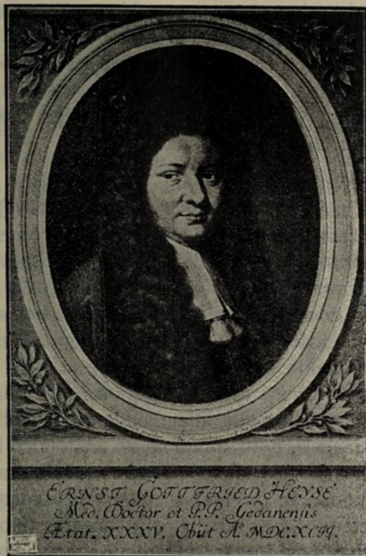
Ernst Gottfried Heyse według portretu i sztychu Eljasza Heinzelmanna.

12. Szereg drobnych notatek dotyczących anatomji kreta, jeża, wydry, jagnięcia, foki itp. ogłaszanych jako Miscellanea. 1671. 1672.