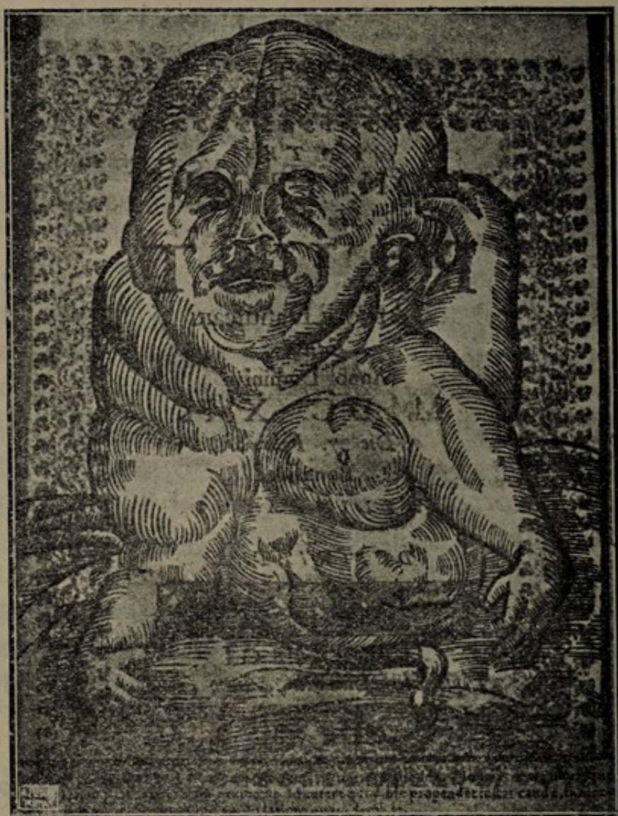
Rycina teratologicznego płodu z dzieła Olhafiusa: Foetus monstruosus... 1613. Przez bibulasty papier przebija druk i ornamentyka odwrotnej strony.

Z różnorodności dzieł i poruszanych tematów można wnosić, że zawarte w nich spostrzeżenia były często oparte na oryginalnych sekcjach, wykonanych w Gdańsku. Świadczy o tem np., opis teratologicznego płodu: Foetus monstruosus in pago Prust teritorii Dantiscani editur a 1613 bona fide delineatur et conscriptur 1613.