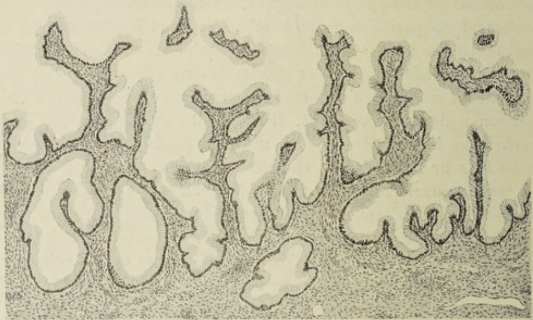
Figure 1. — Kyste papillaire simple (BENDER).

J'ai insisté dans ma seconde proposition sur la différence qu'il y a entre les véritables métastases, sûr indice de malignité, et les greffes par simple implantation des végétations papillaires sur le péritoine. Freund 1 a depuis longtemps bien indiqué cette distinction capitale, qui a été confirmée par de nombreux auteurs 2 . Cependant elle a été souvent méconnue et la présence de ces végétations disséminées a souvent effrayé des opérateurs au point de les faire renoncer à compléter une opération commencée. D'autre part, des chirurgiens plus audacieux ont