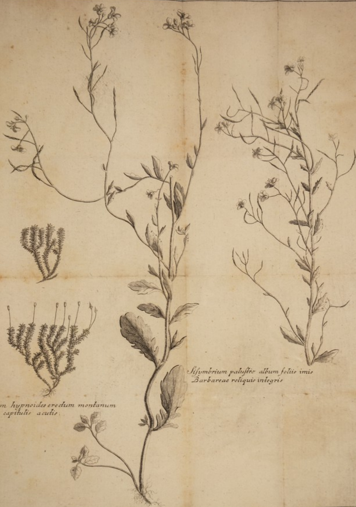
Bryum hypnoides erectum montanum erectis capitulis acutis.