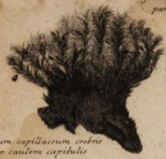
Bryum capillaceum crebrius per caulem capitulis C. J. Rollins. Med. Calm.