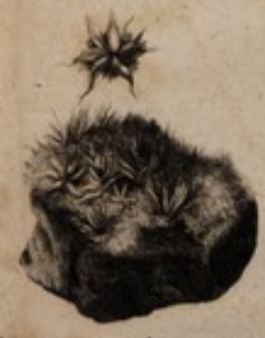
Sphagnum aculeum maximum foliis in centro aliaribus.