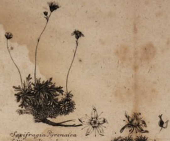
Saxifraga Pyrenaica foliis partim integris. partim trifidis.