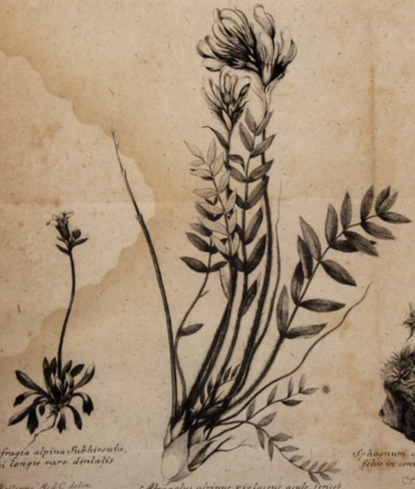
Saxifraga alpina subhirsuta, foliis longie raro dentatis C. J. Rollins. Med. Calm.