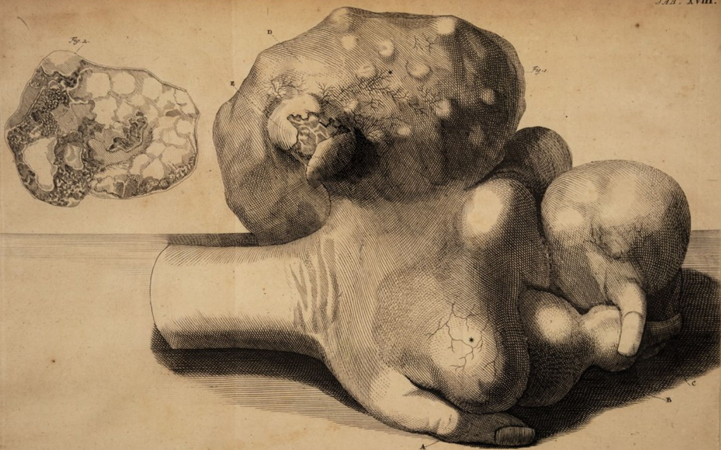
Huberts. ad vivum Sculptit.