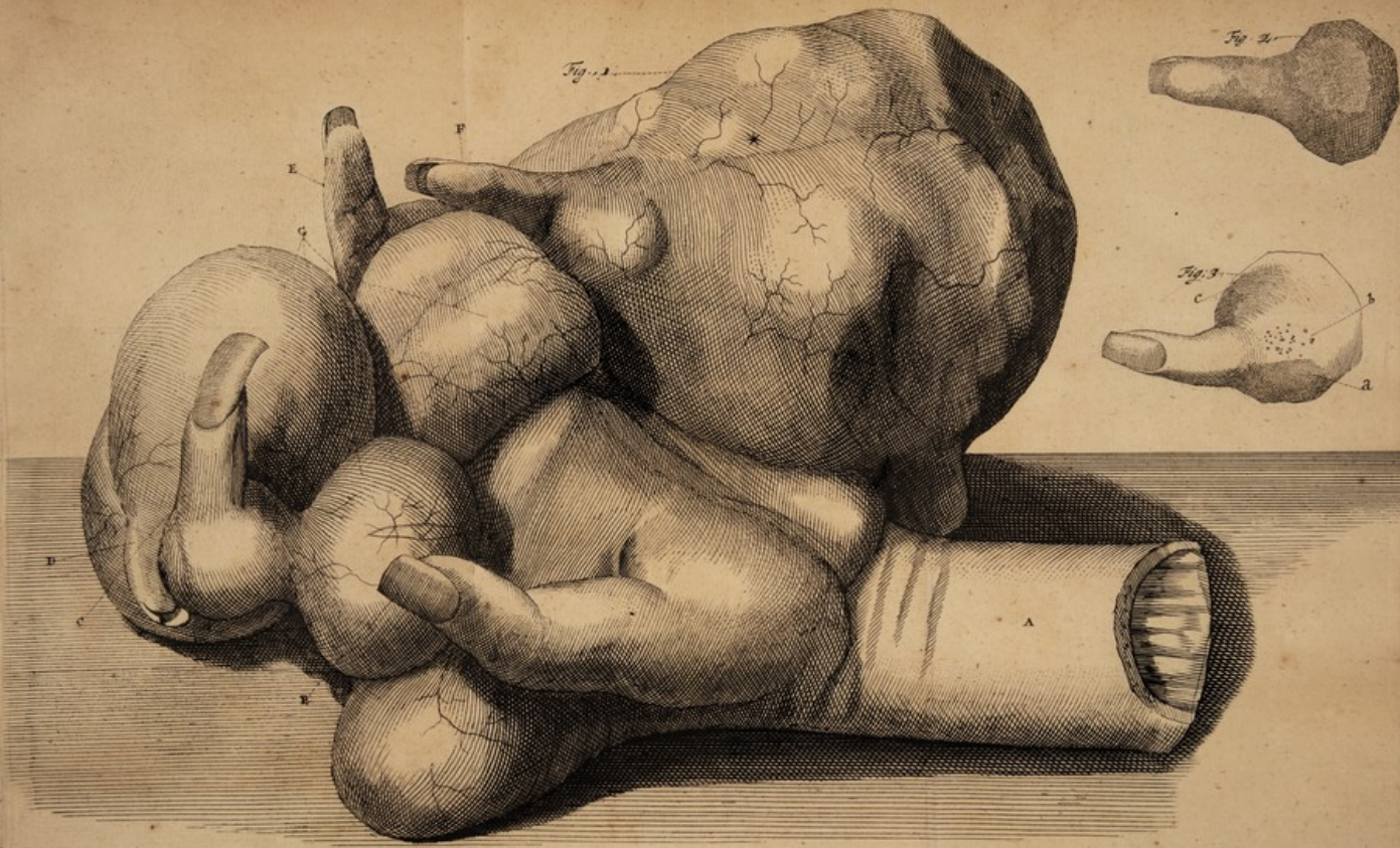
C. Fischer, del. vivum. Sculpit.