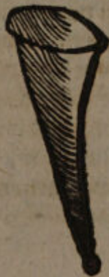
Figura Cannæ talis est.

Recordor CL. BARNERUM quondam Patavii pulverem anatron ex lithargyrii ℥ij. seobis martis, vitri veneti ℥ij & silicum calcinatorum ℥iiij. pulverisatis & per septem horas in crucibulo fusis parasse, atque illo margini colli vitrei probè ignito asperso moxque liquato aliam vitri portionem pariter calefactam impossuisse, atque simul colliquatis ostium vasis hermetice sigillasse.