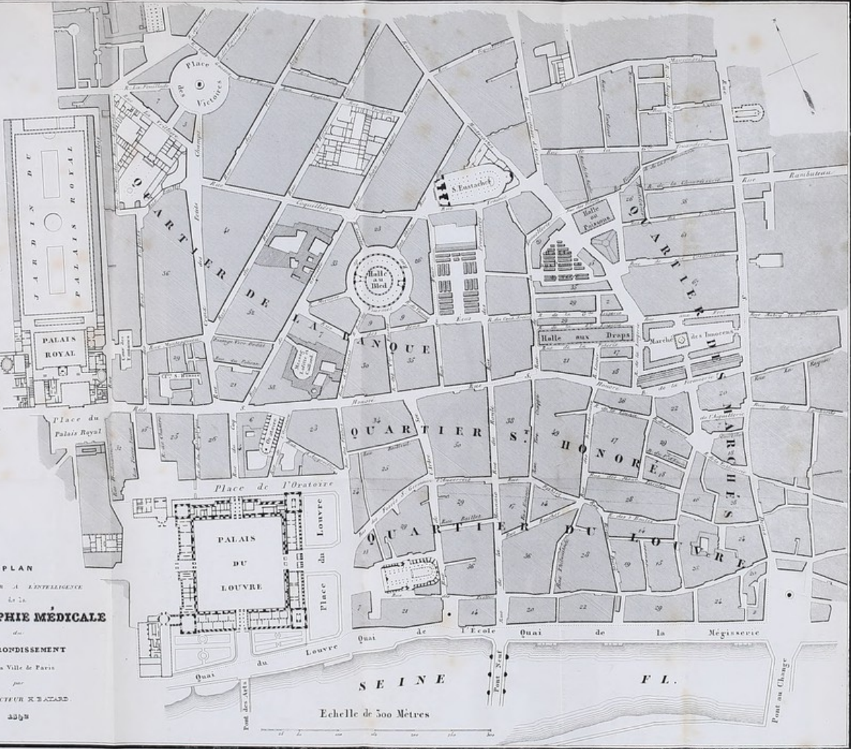
PLAN POUR SERVIR À L'INTELLIGENCE de la TOPOGRAPHIE MÉDICALE du IV e ARRONDISSEMENT de la Ville de Paris par M. LE DOCTEUR R. BAZARD 3374