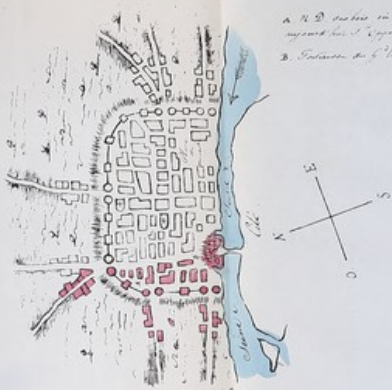
1 er Plan de la ville de Paris an 528.)