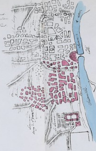
2 e Plan (an 1150.)

Cartographe & Graveur, à Paris, chez M. de la Harpe, 17.