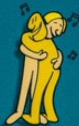
Serrer une personne dans ses bras