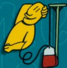
Donner son sang