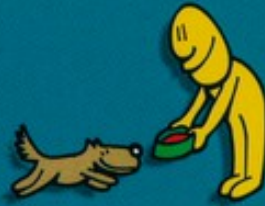
Soigner les animaux