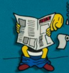
Utiliser les toilettes publiques