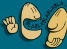
Parler avec une personne séropositive