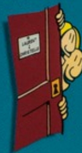
Habiter avec une personne qui a le virus du SIDA