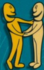
Se donner la main