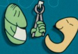
Aller chez le dentiste