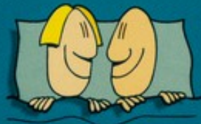
Dormir avec une personne séropositive