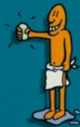
Partager un savon