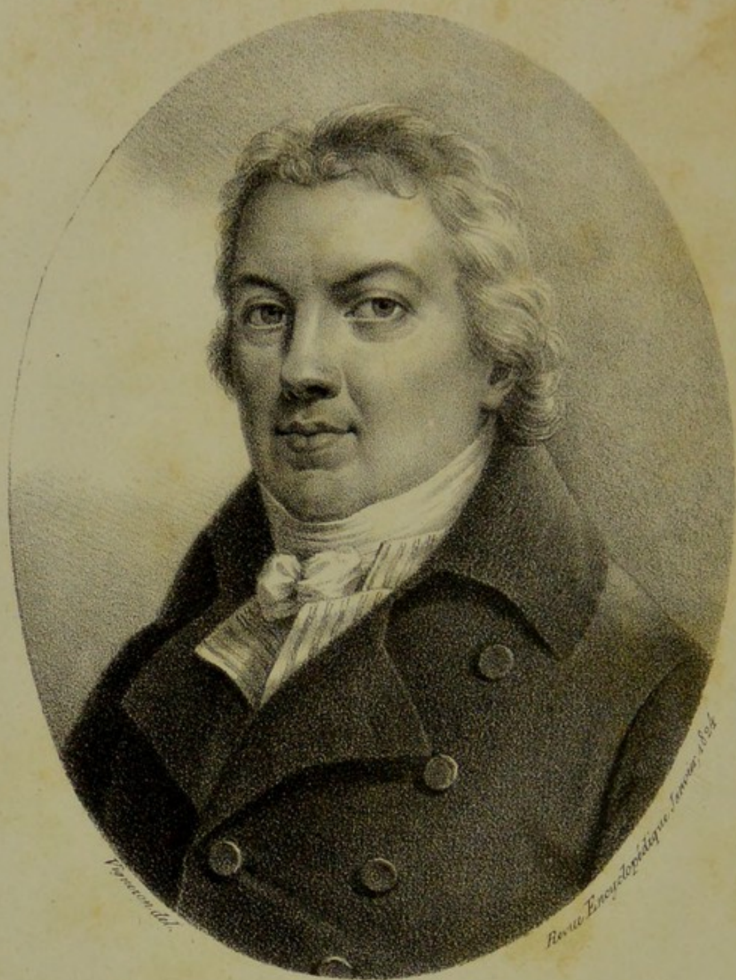
Edouard Jenner, Inventeur de la Vaccine.