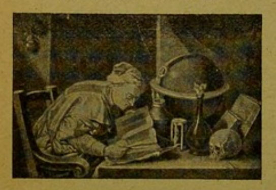
Der Arzt als Goldmacher.