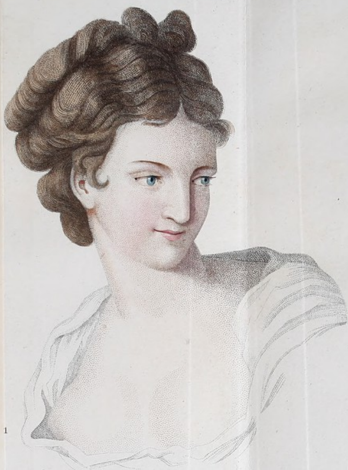
Jeune femme de Vienne, âgée de 23 ans.

Peint d'après nature par le D r J. H. Schneider.