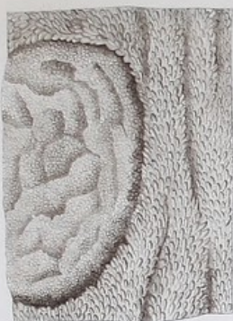
6 fois 1/2 grandeur naturelle.