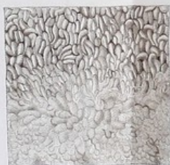
6 fois 1/2 grand. nat.