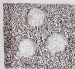
15 fois grand. nat.