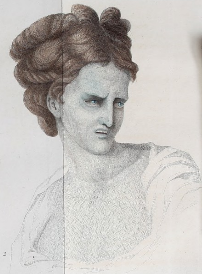
La même, l'heure après l'invasion du Choléra, et 24 d'heure avant sa mort.

Peint d'après nature par le D r J. H. Schneider.