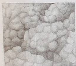
15 fois grand. nat.