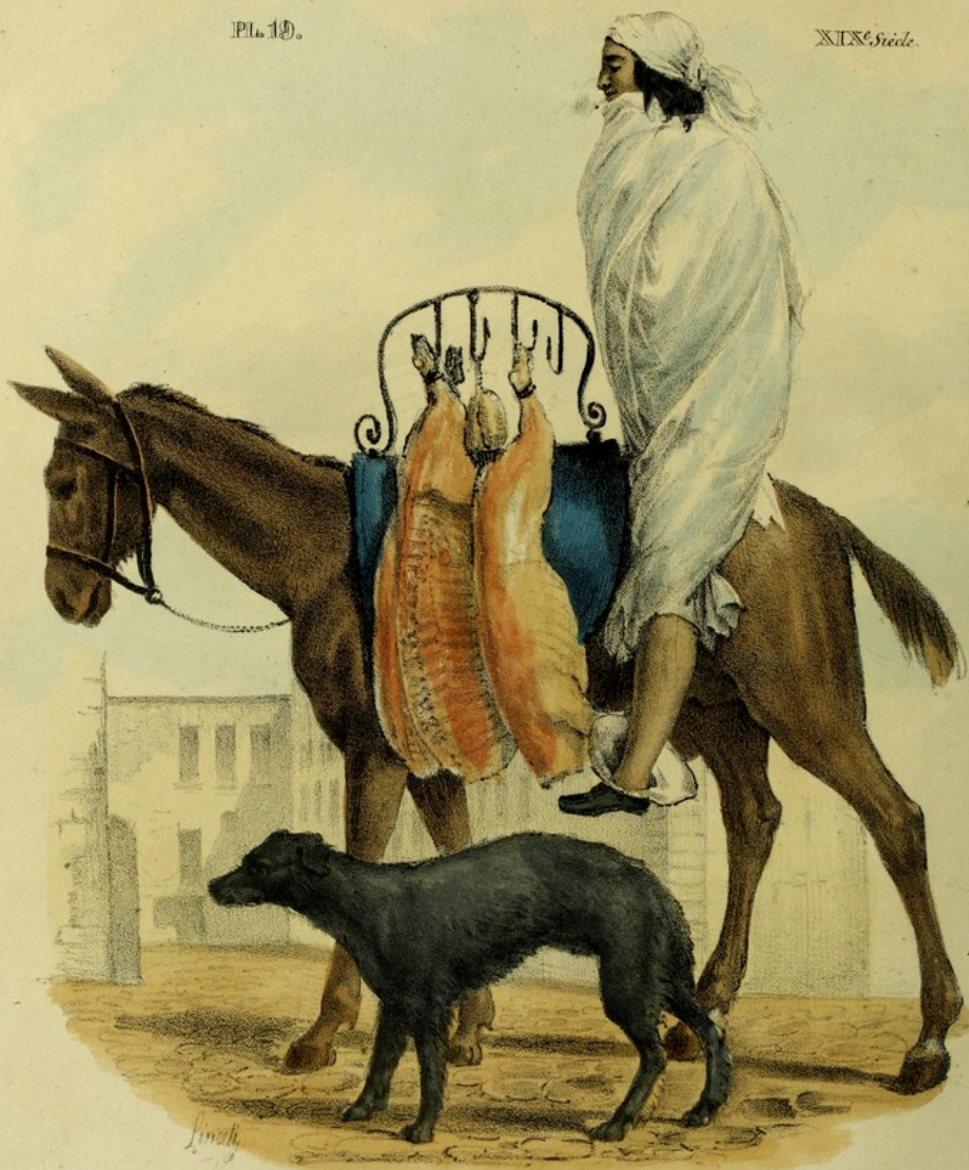
COSTUMES MEXICAINS. Boucher ambulante dans Mexico.