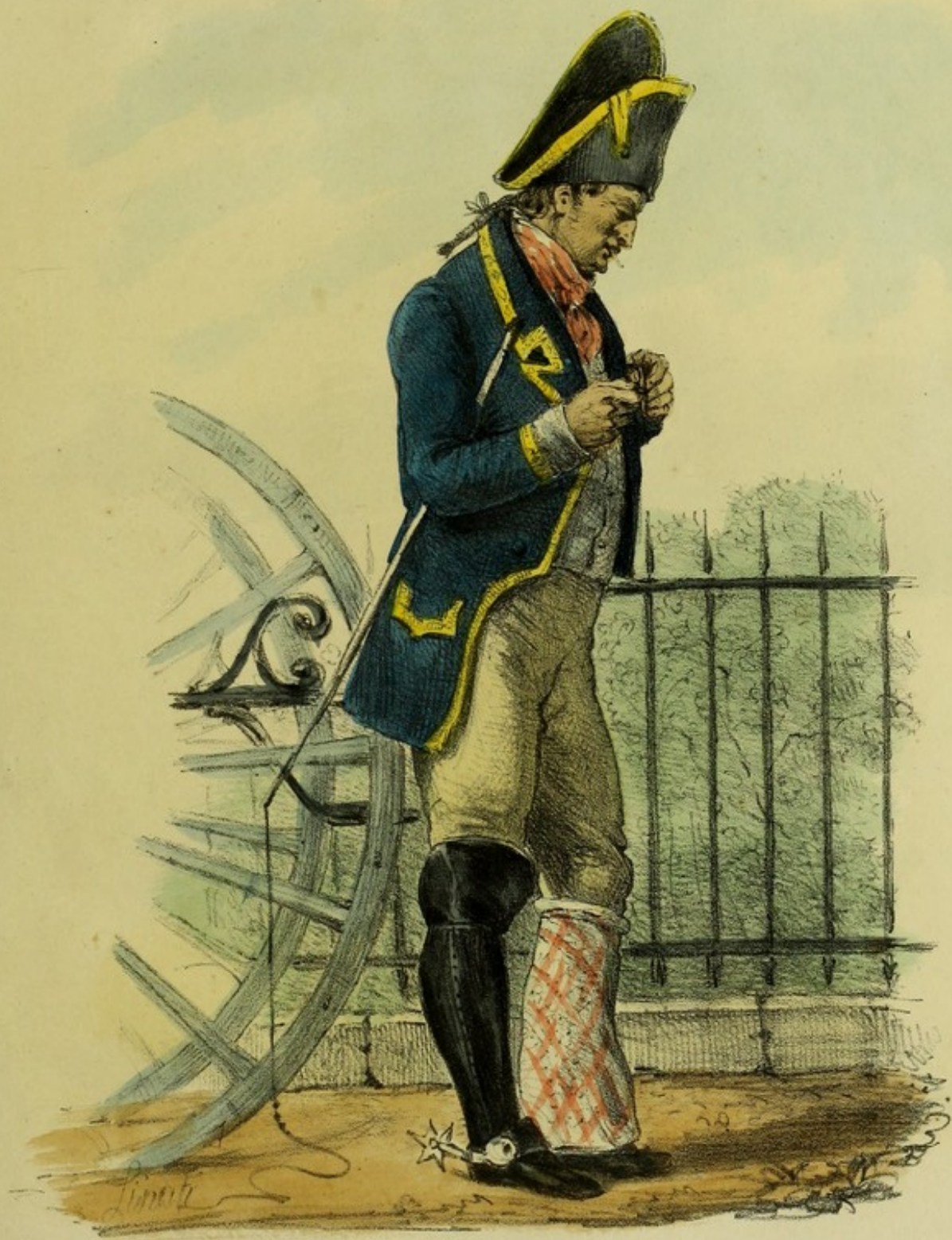
Cocher d'une maison noble. Chaussé d'une seule botte.