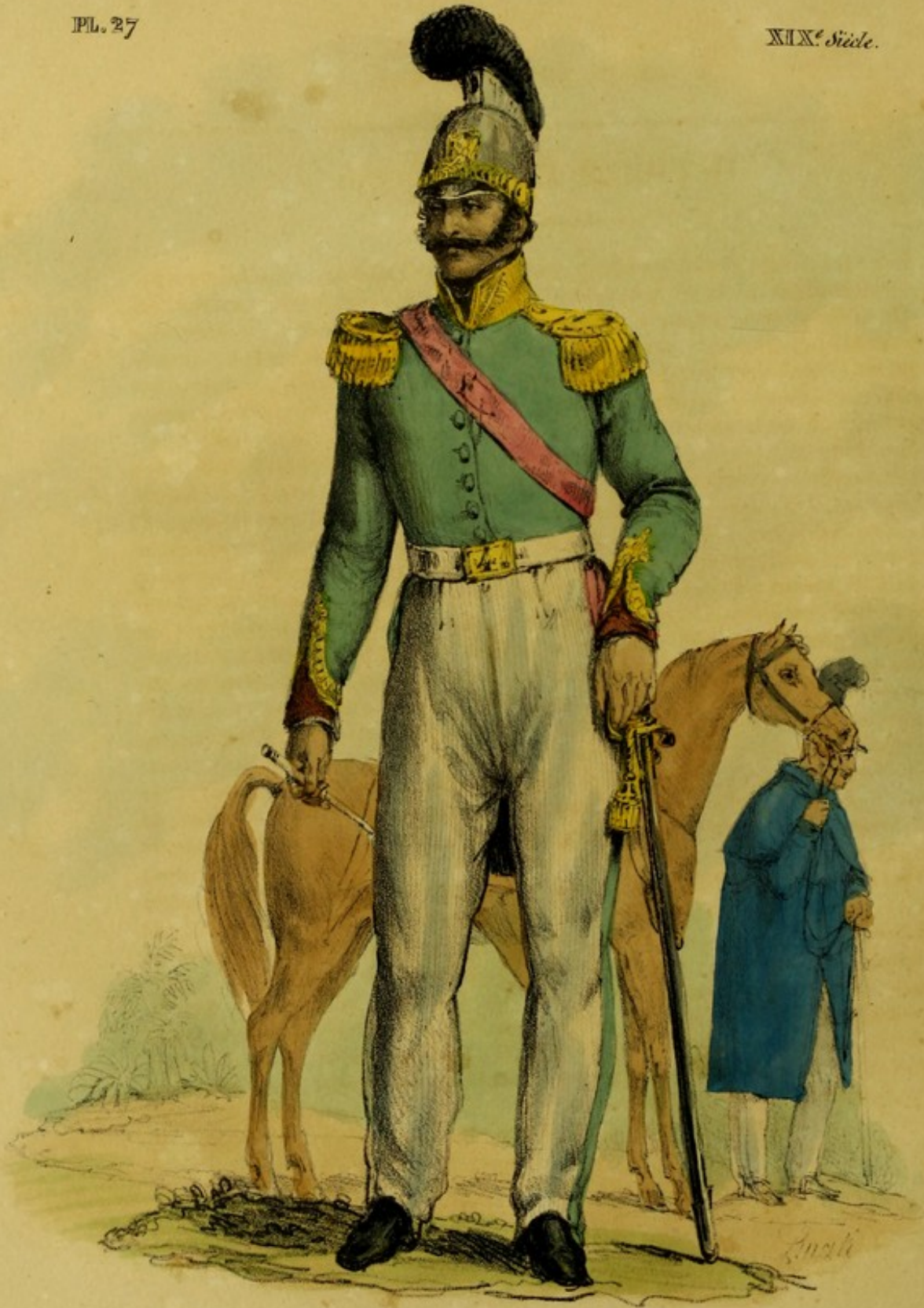
COSTUMES MEXICAINS. Officier de Dragons. Nouveau Costume