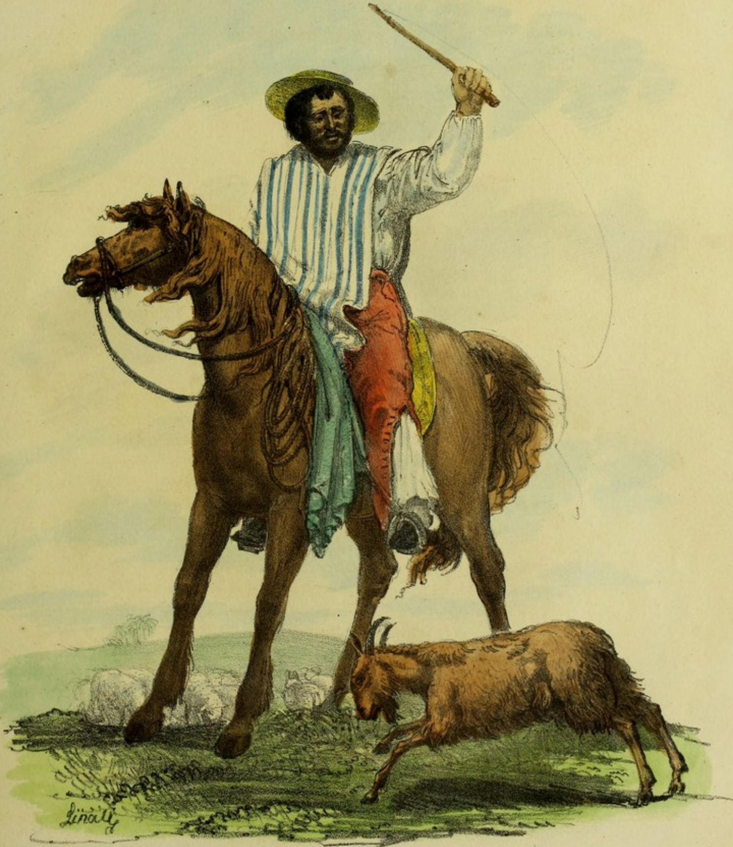
BERGER MEXICAIN .