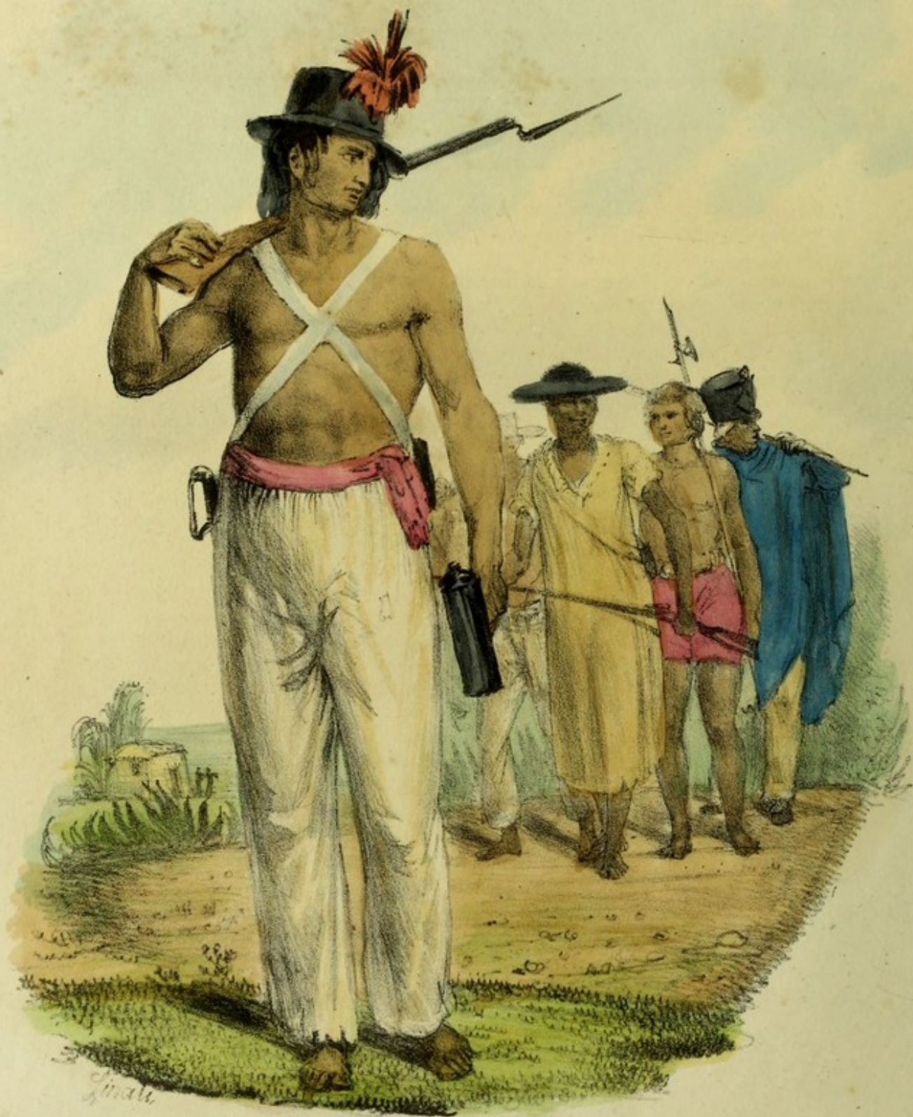
Garde Civique D'ALVARADO (descendant)