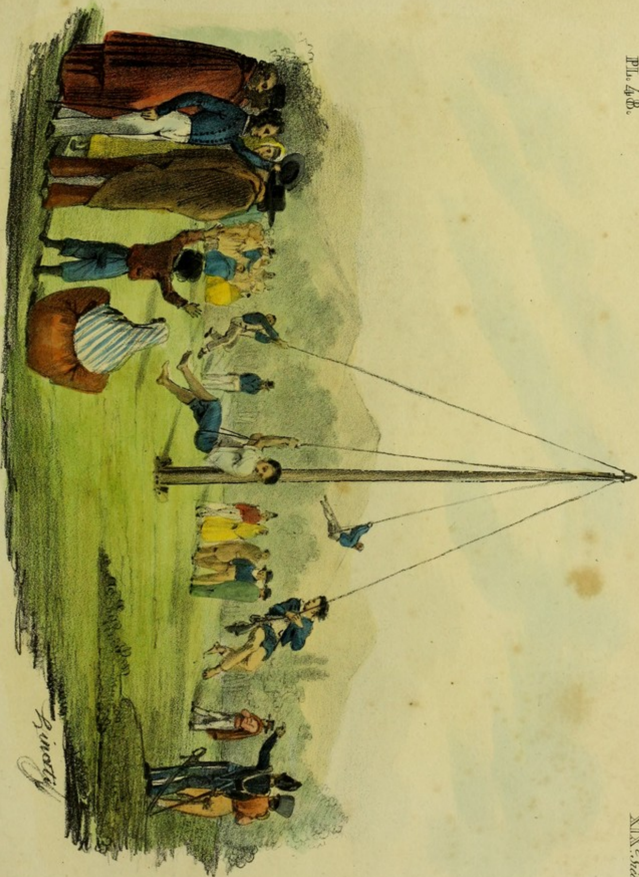
L'enjambée des Ceans. Jeu Maritime.