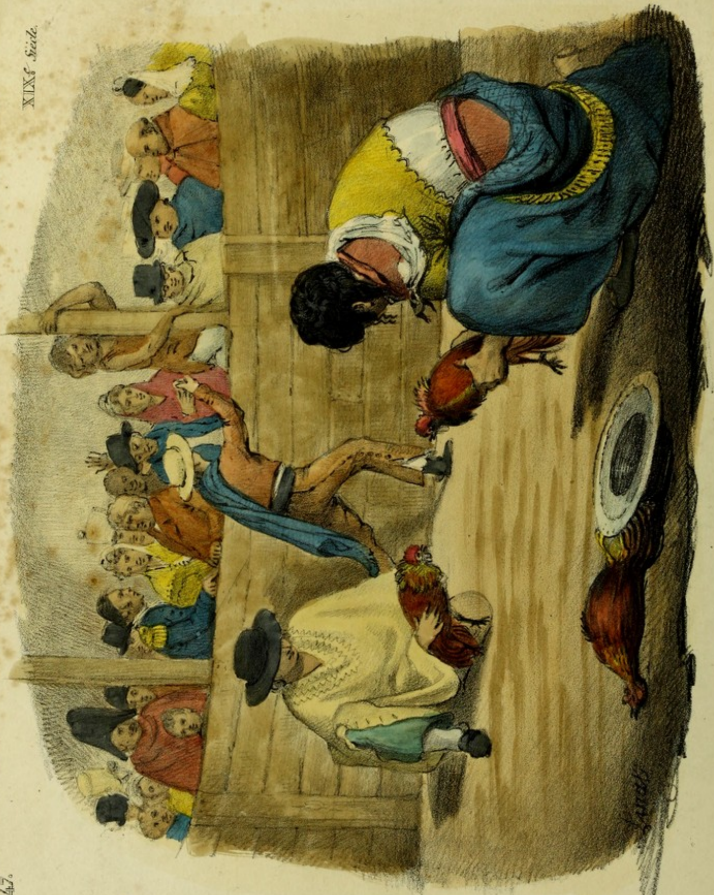
Pelea de Gallos. Combat de coqs.