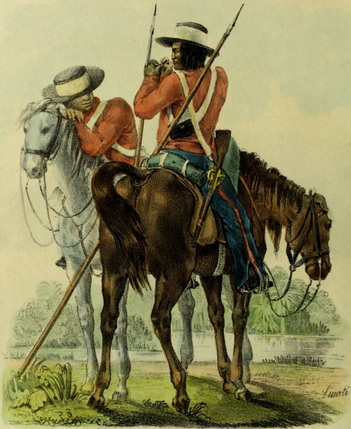
COSTUMES MEXICAINS. Miliciens provinciaux de Guazacualco. Les oreilles des chevaux sont rongées par les garapatas.