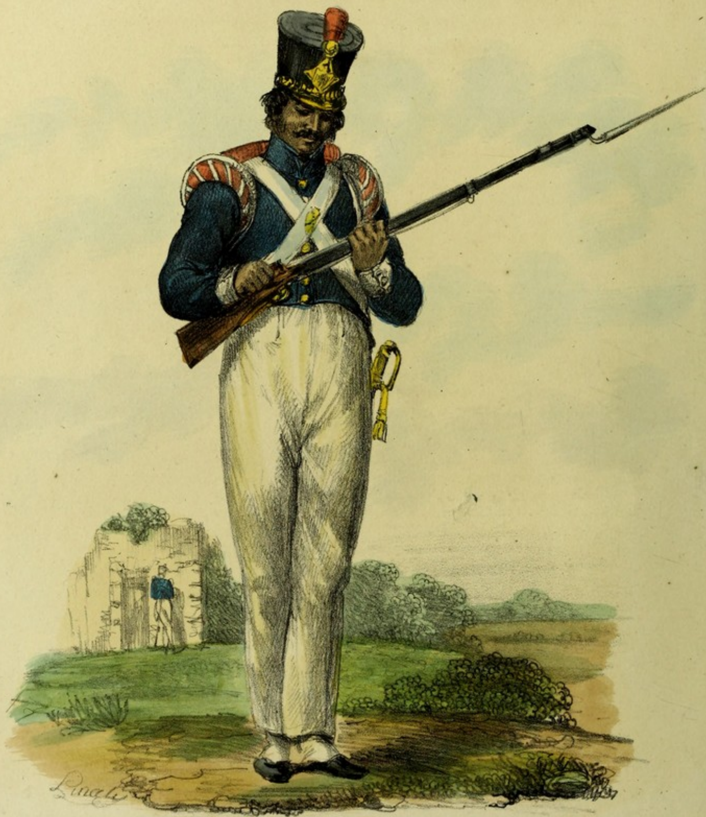
Fantassin en grande tenue. Nouveau Costume.