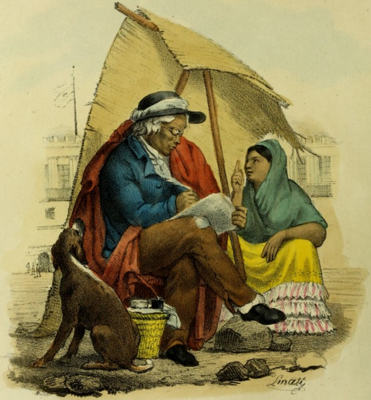
COSTUMES MEXICAINS. Ecrivain public, sur la grand'place à Mexico.