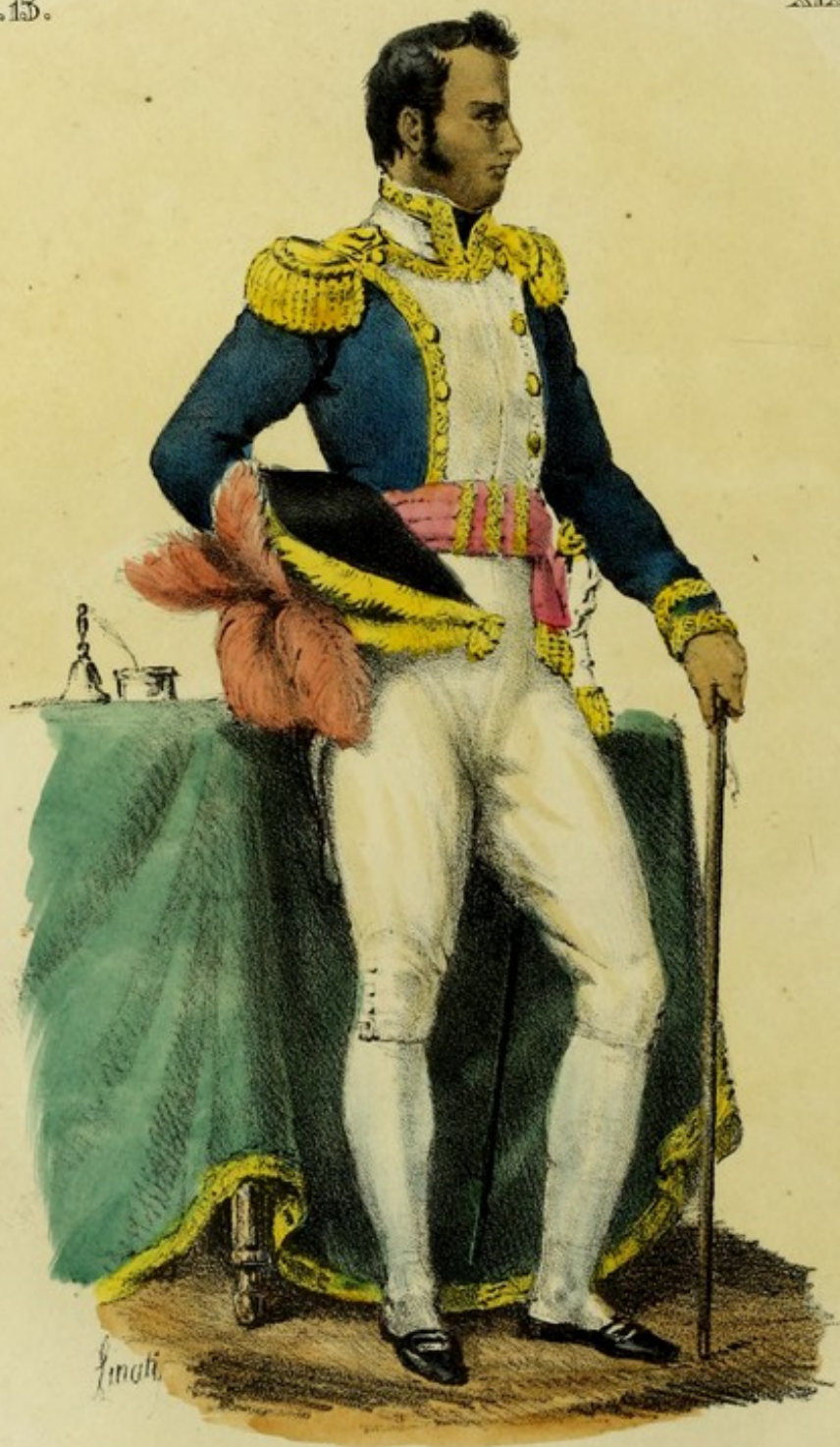
COSTUMES MEXICAINS. Le général Guadalupe Victoria. Président de la république Mexicaine.