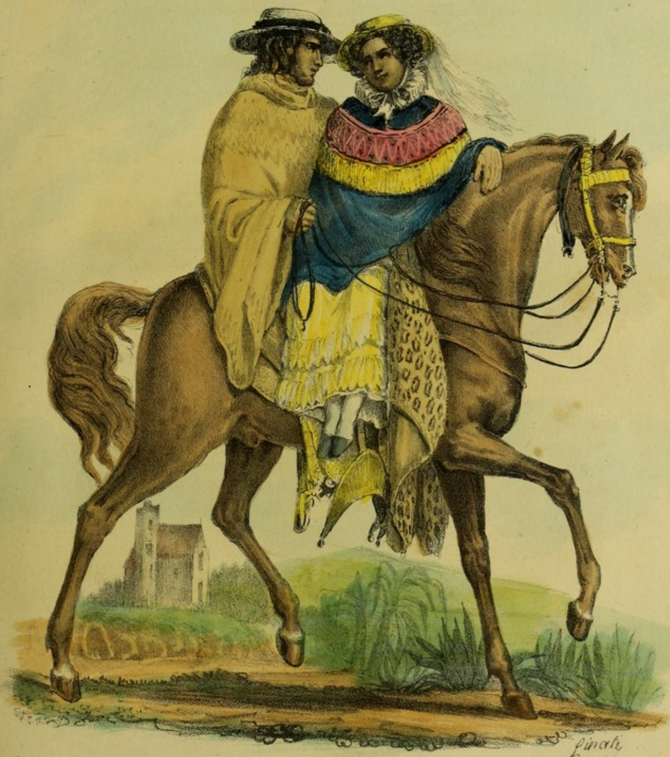
COSTUMES MEXICAINS. Manière de voyager des Dames au Mexique. Armas de Agua ou couvre-selle de peau de panthère.