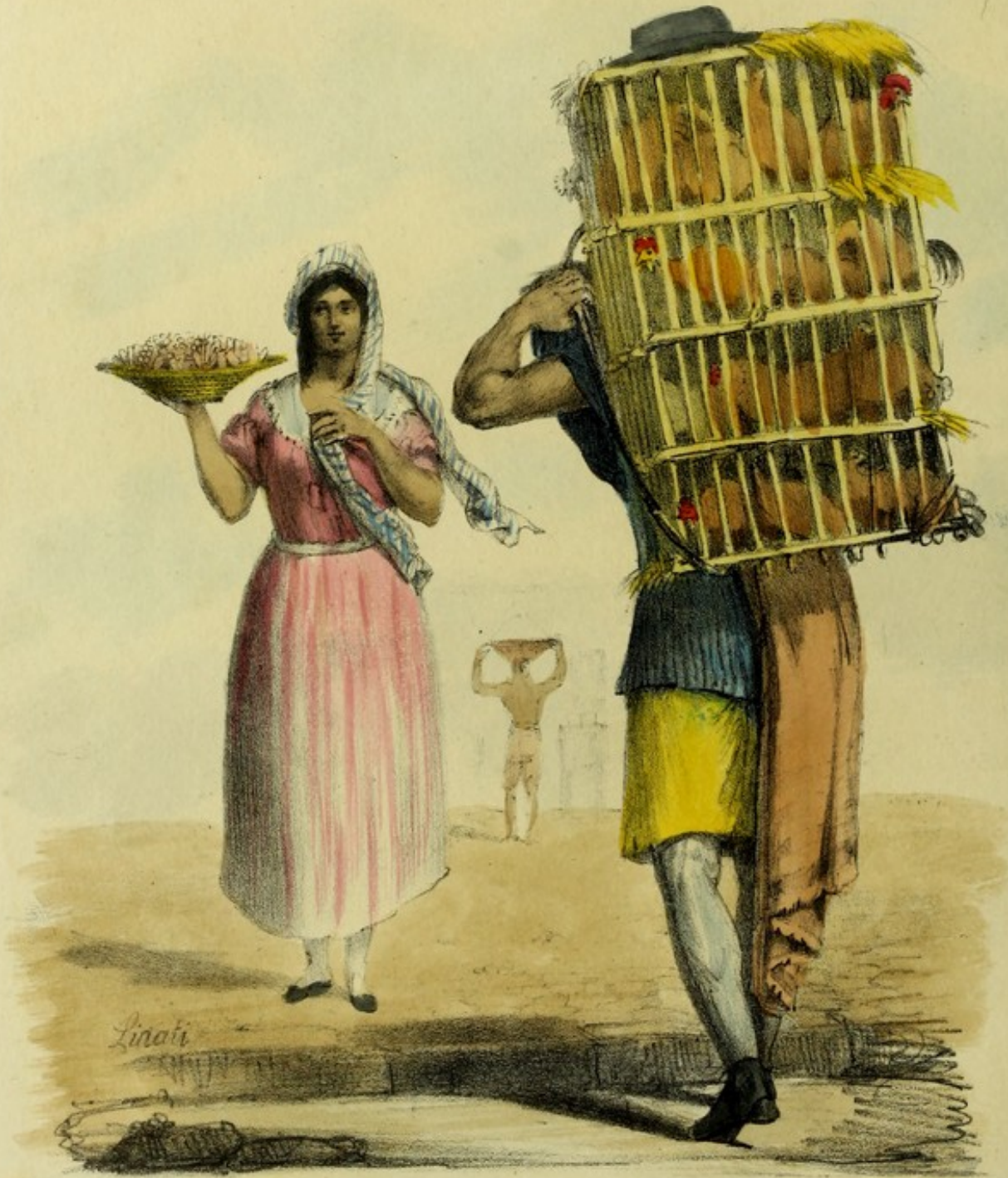
Marchand de Volailles. Marchand de Graisses. Marchande de Bonbons.