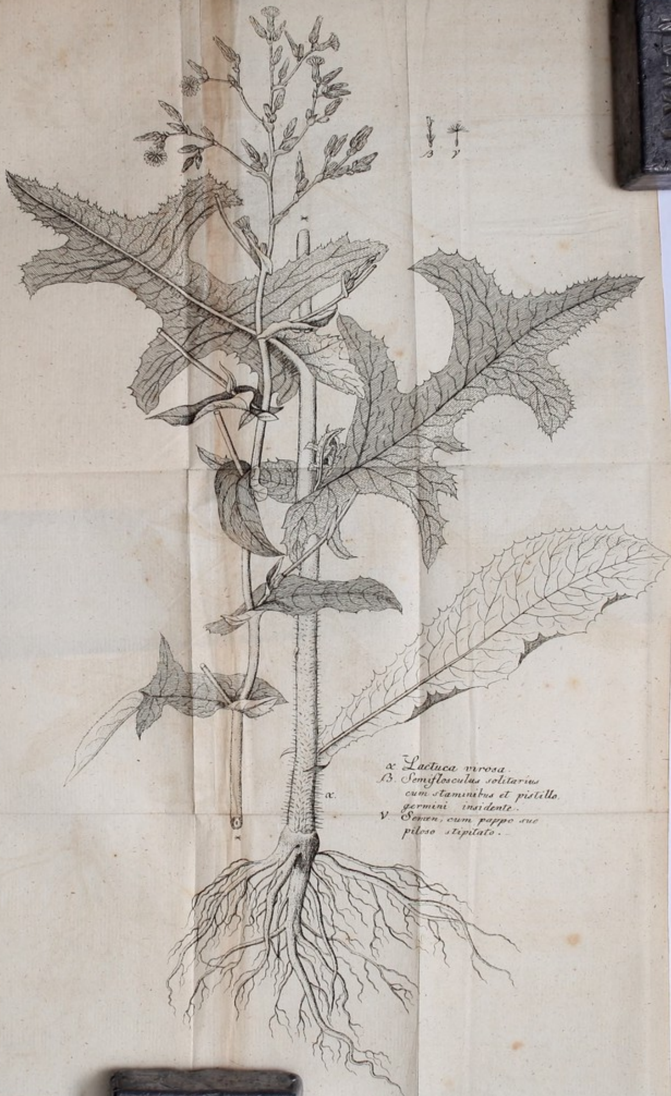
α. Lactuca virosa. B. Semiflosculus solitarius cum staminibus et pistillo, germini insidente. V. Semen, cum pappo suo piloso stipitato.