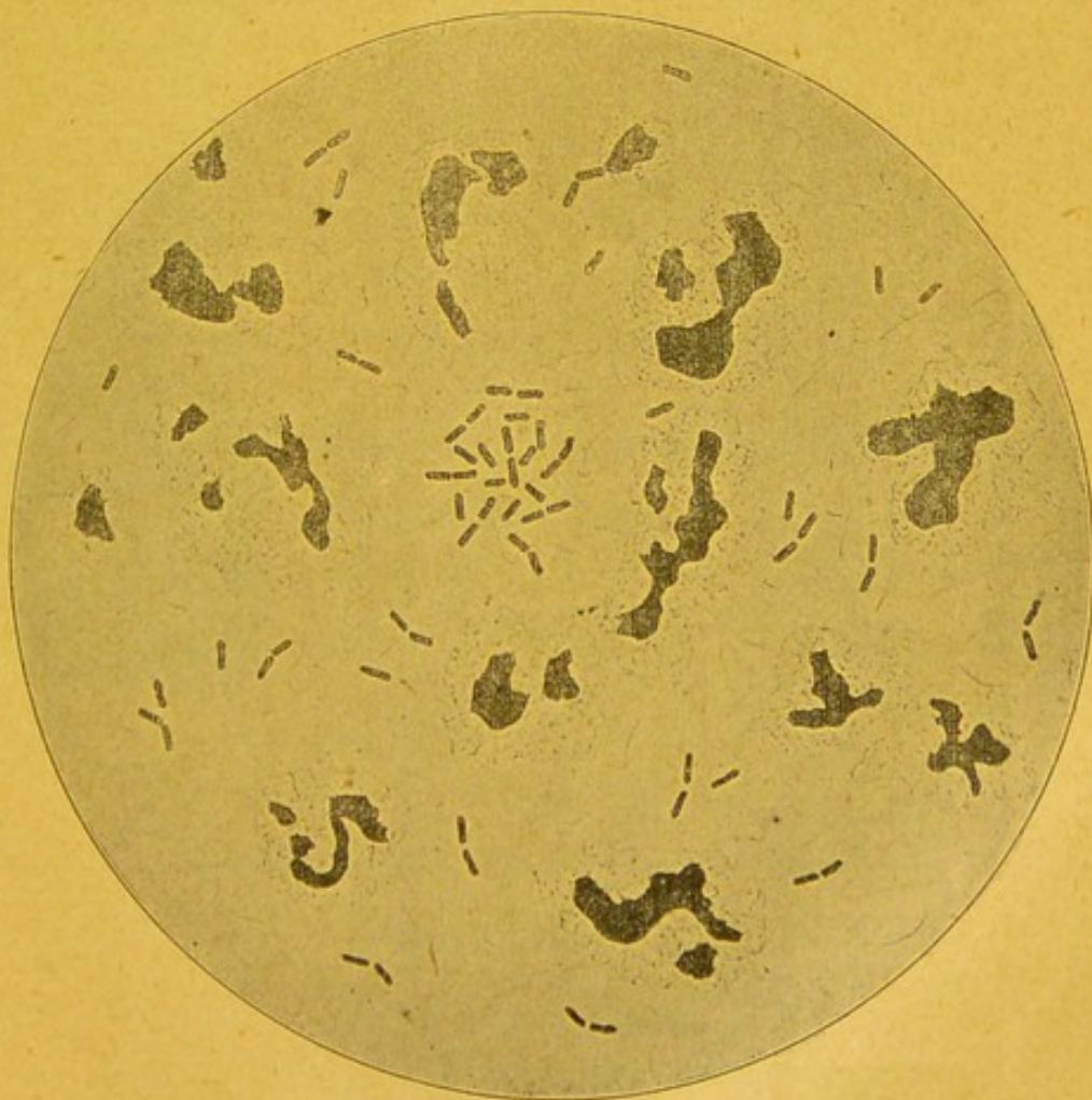
Diplobacilles de Morax. (Objectif à immersion 1/12 oculaire 3.)