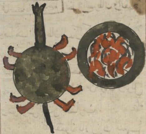
تم صفة السرطان والقمر وهو ما