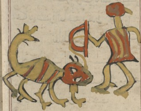
تم صفة القوس والمشري