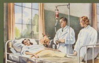
Bijkomende kosten van een bloedtransfusie