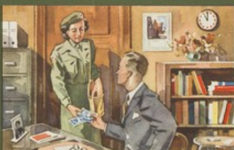
Alle Rode Kruis-taken voor Uw rekening gedurende 5 minuten