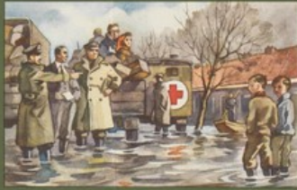
Eerste hulp bij rampen voor een gezin