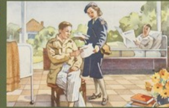
Lectuur voor zieken en herstellenden