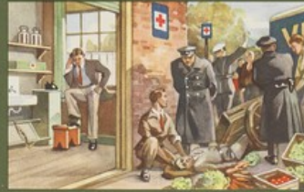
Inrichting van een hulppost langs de weg