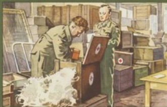
Opgeslagen voorraden voor een slachtoffer in nood