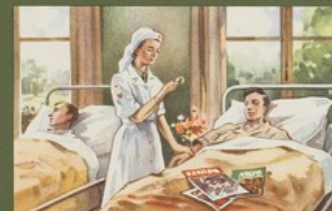
Een dag verpleging in een Rode Kruis noodziekenhuis