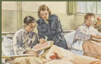
Welfare-werk voor zieken