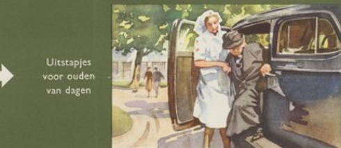
Uitstapjes voor ouden van dagen