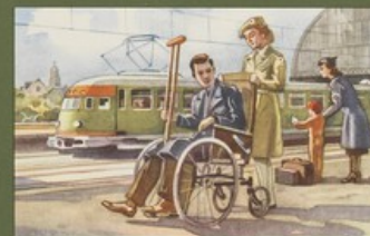
Hulp bij vervoer van invaliden