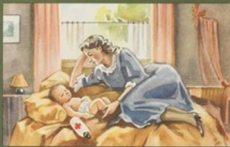
Geconserveerde moedermelk voor zwakke zuigelingen