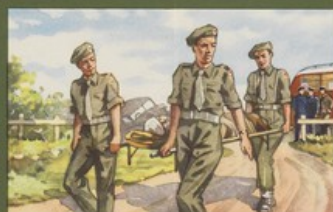
Een draagbaar met toebehoren voor een gewonde