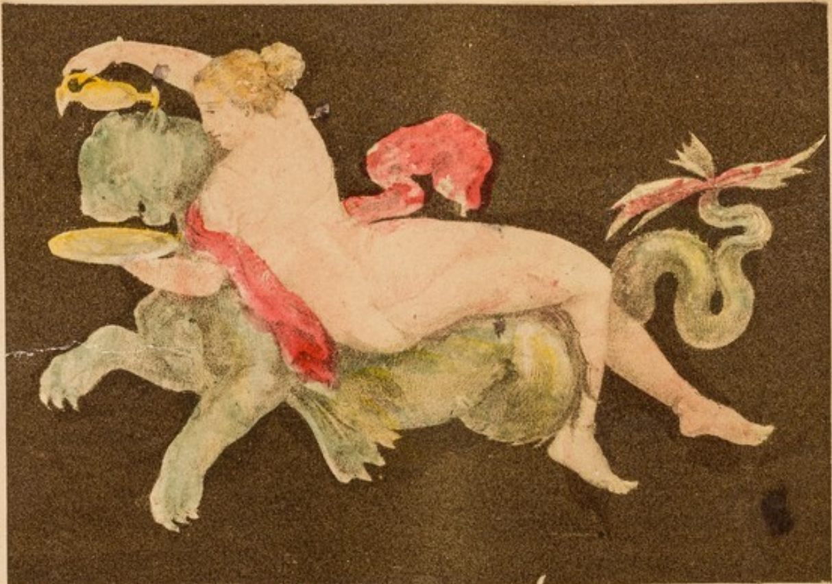
Escudo de la ciudad de Pompei.