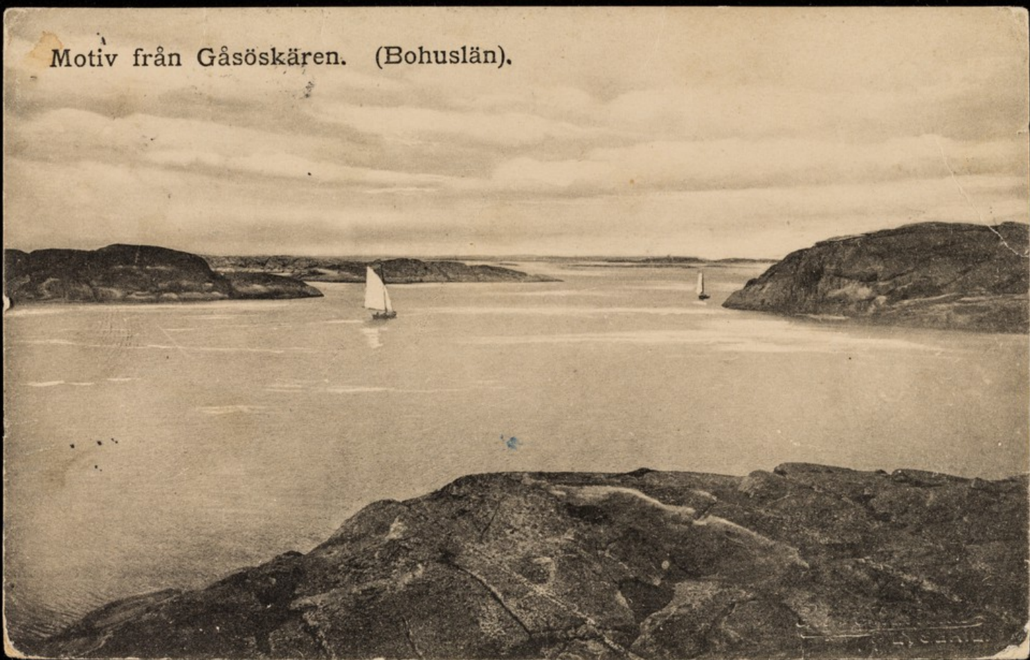
Motiv från Gåsöskären. (Bohuslän).