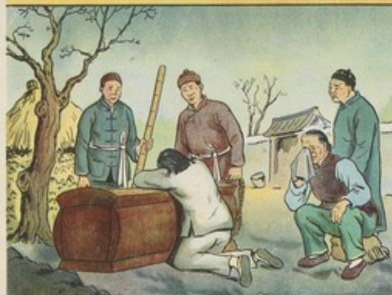
四 亞蘭受過萬般痛苦，懂得翻身道理，所以更能發揮其積極性，在勞動中起模範作用。