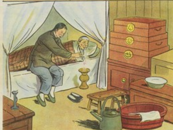
二 亞蘭受過萬般痛苦，懂得翻身道理，所以更能發揮其積極性，在勞動中起模範作用。