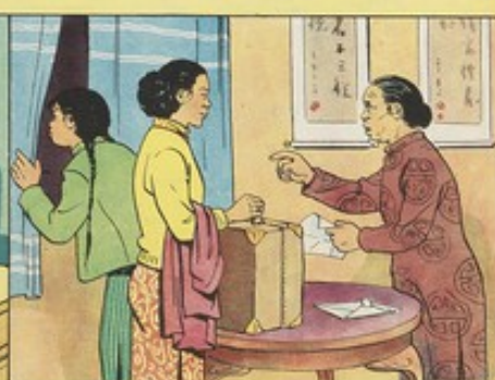
6. 婆婆把來信藏了不許秀雲去，却叫一個姑婆去幫子良理家。