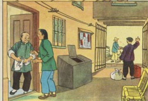
8、第二天清早，阿水上船，巧珍付上大錢，說：『我的阿水，叫他到碼頭來。』一面假裝對阿水拿行李上船。