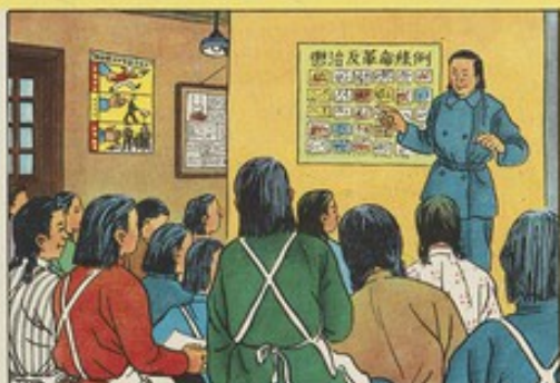
6、巧珍經過學習，她學會了革命道理，革命道理，革命道理，革命道理。