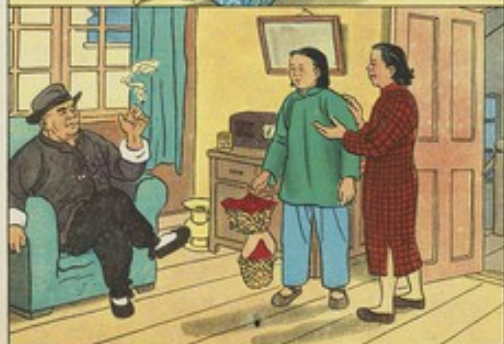
2、巧珍到了過物同鄉家去拜威威作客，威威不讓她人做伴。