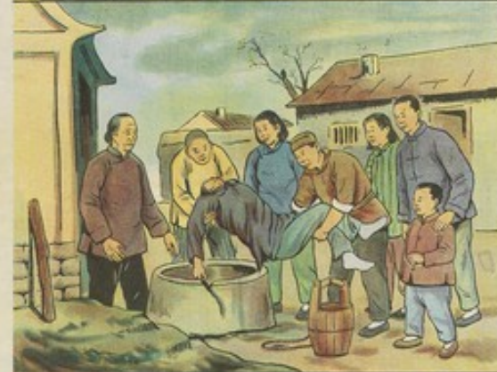
六 亞蘭受過萬般痛苦，懂得翻身道理，所以更能發揮其積極性，在勞動中起模範作用。