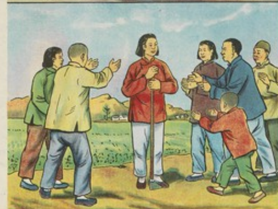
八 亞蘭受過萬般痛苦，懂得翻身道理，所以更能發揮其積極性，在勞動中起模範作用。