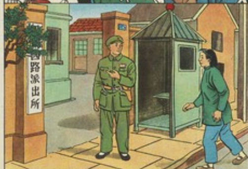
7、正是大鬧天宮，巧珍見阿水打算逃走，便跑去派出所報告。