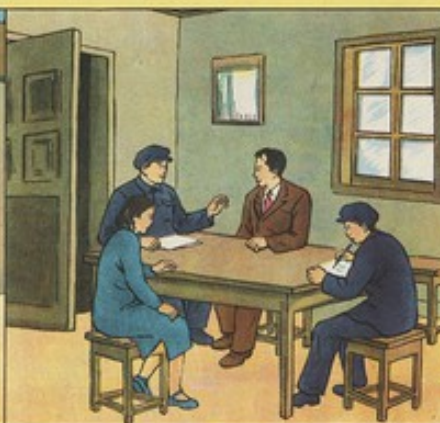
8. 經過法院教育趙麟的見異思遷的錯誤思想，駁回訴訟。