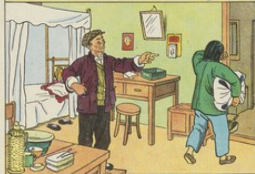
4、巧珍被威威轟走了，她不敢反抗，眼淚往肚裏吞。