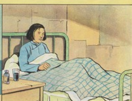
9. 離婚後秀雲受創太深，因此成病不能工作。