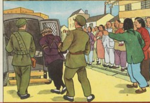
10、被公家捉去的阿水，終於逃不脫人民的法網，被公家捉去了。