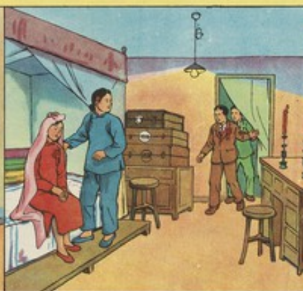
2. 兩人於一九三九年任濟南結了婚。