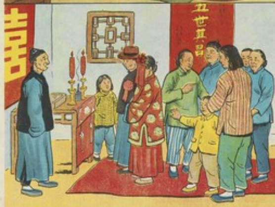
三 亞蘭受過萬般痛苦，懂得翻身道理，所以更能發揮其積極性，在勞動中起模範作用。