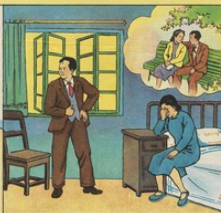
5. 玉鍊知道了，從濟南趕來上海，兩人時常為此爭吵鬧。