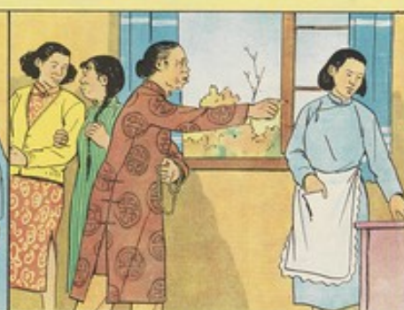
3. 姑婆常常挑弄是非，婆婆因此對秀雲不滿，常常嘖嘖，秀雲只是忍著。