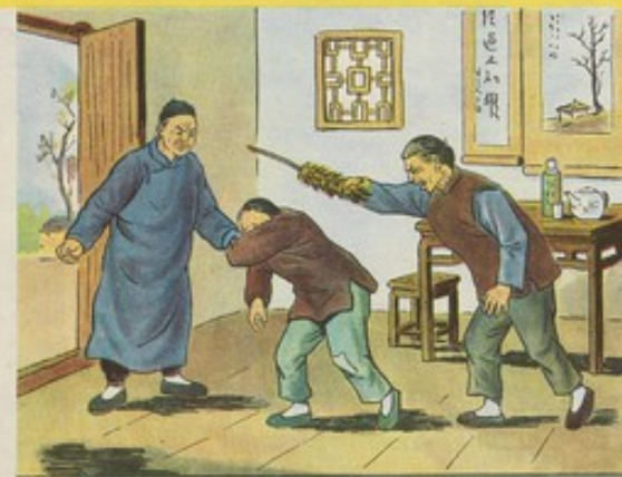
五 亞蘭受過萬般痛苦，懂得翻身道理，所以更能發揮其積極性，在勞動中起模範作用。