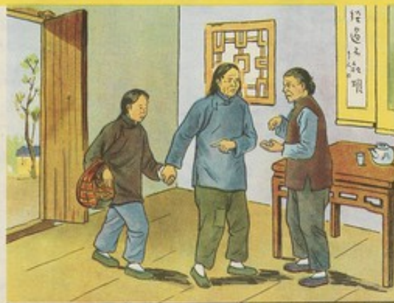
一 亞蘭受過萬般痛苦，懂得翻身道理，所以更能發揮其積極性，在勞動中起模範作用。