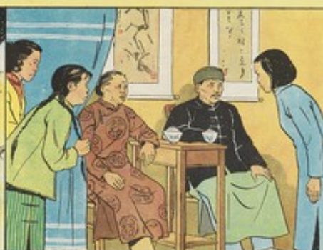
2. 結婚後張家公婆，喜禮教管家僕，還有兩個 Concubine，秀雲出落。