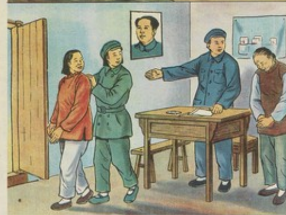
七 亞蘭受過萬般痛苦，懂得翻身道理，所以更能發揮其積極性，在勞動中起模範作用。