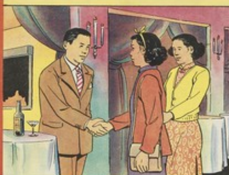
7. 姑婆到了漢口，替子良另外介紹女友，從此同居，遺棄秀雲。