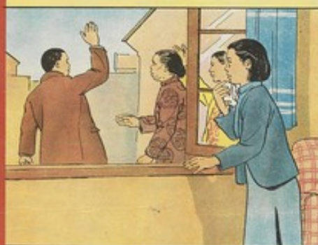
4. 婆婆姑婆又在子良面前說秀雲的壞話，子良便到漢口去找工作，想帶秀雲同去，婆婆不許。