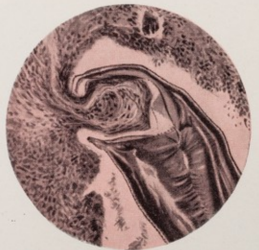
O ancilóstomo fixa-se à parede do intestino e suga o sangue obtido por uma diminuta dilaceração da mucosa.