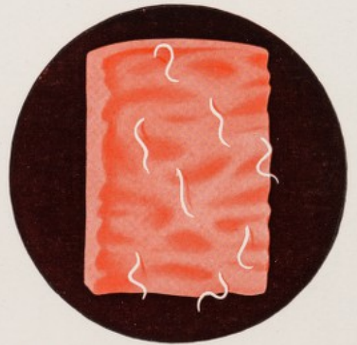
Ancilóstomos adultos prendidos à parede do intestino. Nos casos de infestação intensa o número de vermes albergados no intestino delgado pode ser de 50 a 500.