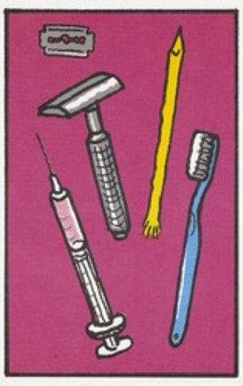
N'utilisez pas les instruments tranchants des autres.

Nettoyez tous les draps, les les malades et leurs vêtements. Nettoyez particulièrement les excréments, le sang, les vomissures et la sueur. Utilisez un désinfectant pour les draps, ou laissez-les sécher au soleil et repassez-les.