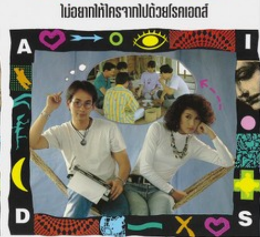
ลูกเป็นสุดที่รักของแม่และพ่อ โรคเอดส์ทำให้ทุกซ์ทรมาน และทำให้หมดอนาคด