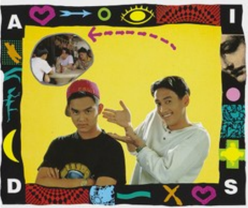
วัยรุ่นอย่าเผลอด้ว-ใจ กินเหล้าทีโร แล้วโปเสียงกับเอดส์