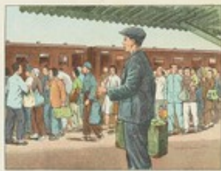
(25) 出門旅行，要攜帶自己的洗臉用品，不用旅館的公用毛巾。