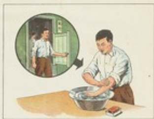
(21) 飯前、便後或工作完畢都要洗手。