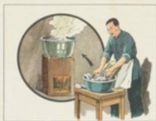
(23) 毛巾應當常常用肥皂洗滌乾淨，並放在鍋裏煮沸或太陽曬曬，以資消毒。