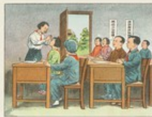
(32) 學校保健老師，要經常向學生講授沙眼防治常識，並組織組織和督促檢查學生的沙眼防治工作。