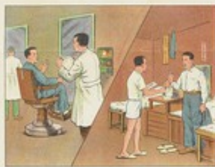
(24) 絕對不用理髮店、澡堂等的公共毛巾擦眼睛。