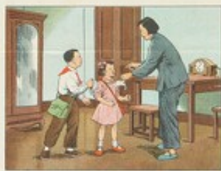
(27) 孩子們的手帕，要經常保持清潔，每天洗滌，而且各用各的，不要混用。