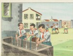
(19) 勤洗手，經常保持手的清潔，可以減少傳染沙眼的機會。