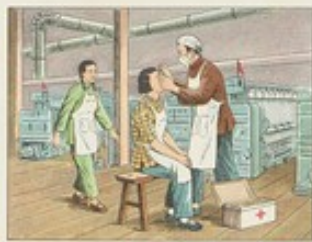
(31) 工廠車間保健員，應當發動群眾，爭取工人兄弟的合作，積極防治沙眼，及時深入車間滴眼藥水。