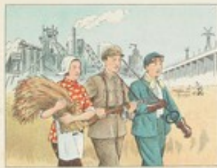
(34) 有了健康的眼睛和健康的體魄，思想上插上紅旗，就能戰無不勝，力爭上游，在社會主義建設事業上躍進再躍進。

在目前衛生事業大躍進的形勢下，醫務人員就發揮革命鬥志，治癒沙眼已經大大地縮短了療程。只要沙眼病人和醫務人員充分合作，積極防治，注意衛生，定期檢查，早期發現，早期治療，沙眼是可以很快被治癒，並且被消滅的。