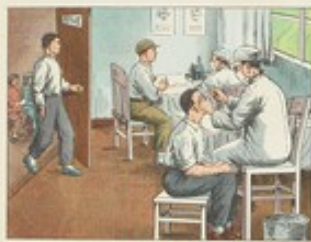
(30) 得了沙眼應當及早醫治，不能拖延，以免變重，影響視力，及早醫治還可避免傳染別人。