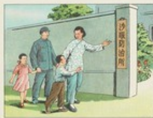
(28) 預防沙眼，由定期進行檢查，倘若發現沙眼，及早治療，容易醫好。