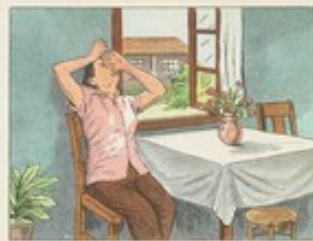
(33) 沙眼是可以治好的，有了沙眼，只要耐心地按時點用眼藥水，就可迅速治癒。