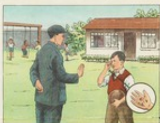
(18) 手指揉擦眼睛，很容易傳染沙眼，我們應當養成手不擦眼的良好衛生習慣。