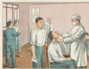
(29) 工廠、學校、機關等集體生活的場所，如果不注意預防沙眼的措施，就很容易傳染到沙眼，所以必須定期進行沙眼檢查。