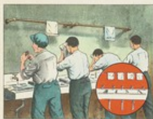
(22) 工廠、學校、機關等集體生活場所，洗臉用具必須分開，不可混用。