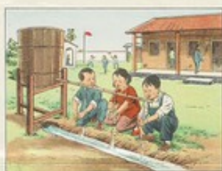
(20) 設有自來水的地方，可以用土辦法來設立洗手龍頭，提倡流水洗臉，洗手。