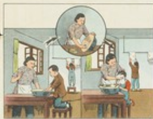
(26) 家庭裏應該實行一人一巾制，合用的面盆擦淨後才能給第二人使用。毛巾用後要分別掛在通風的地方。