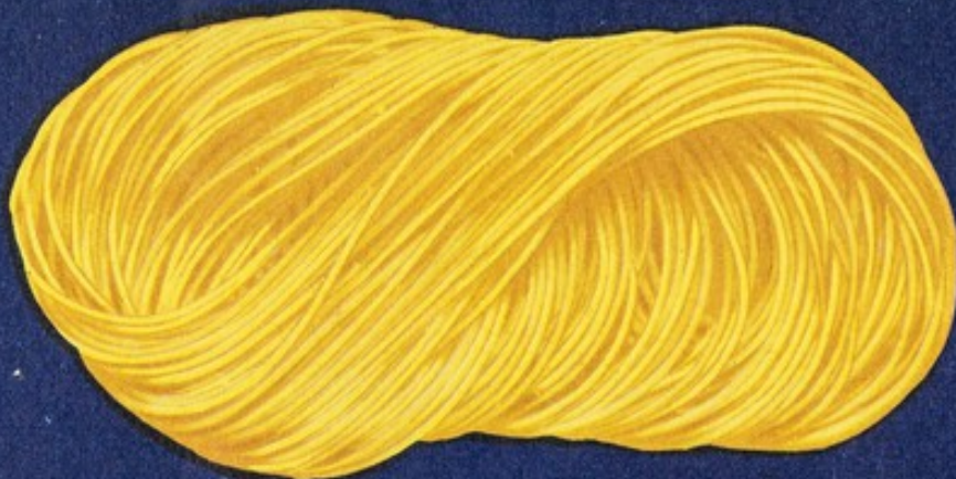
108 Fedelini matassa