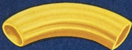
62 Dodici righe