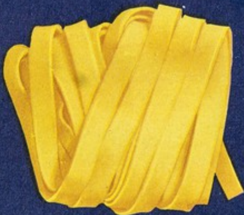
111 Mezze lasagne matassa