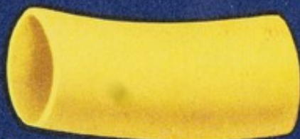
55 Maniche lisce