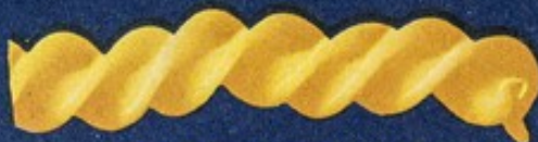
73 Fusillo grande