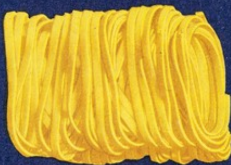
110 Tagliatelle matassa