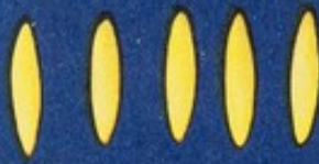
9 Avena grande