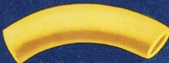
54 Manfroni grossi