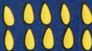
10 Seme mellone