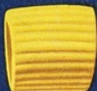
38 Ditali r.