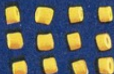
30 Corallini bucati