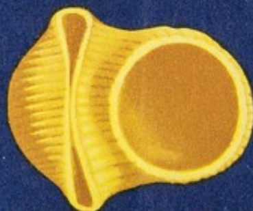
71 Passamontagna grande