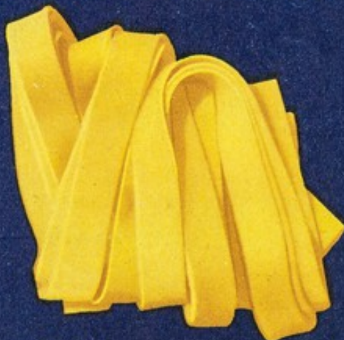
112 Lasagne matassa