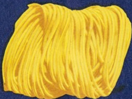
109 Taglioline matassa