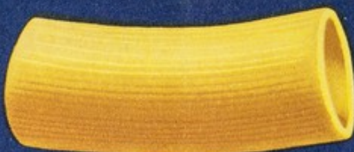
65 Maniche r.