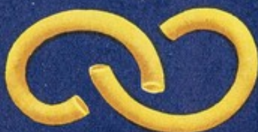
50 Denti pecorino