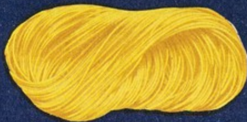
107 Barbina matassa