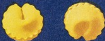
83 Sorprese puntate