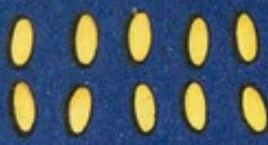
6 Chicco di riso