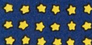
13 Fior sambuco