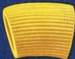
39 Nocciole r.