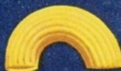
57 Gobetti r.