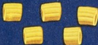
36 Tubetti r.