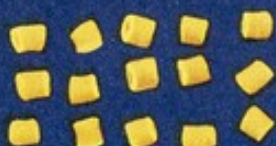
29 Bocche di donna