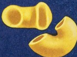
56 Gobetti lisci