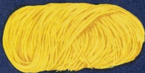
106 Capellini matassa